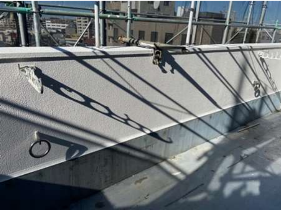
6階ルーフバルコニー 完了