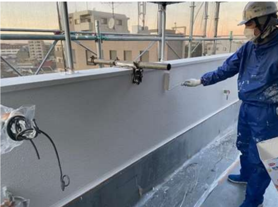
6階ルーフバルコニー 上塗り