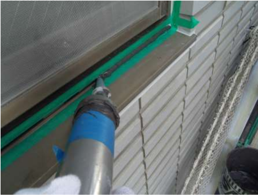
サッシュ水切り上部 新規シーリング充填