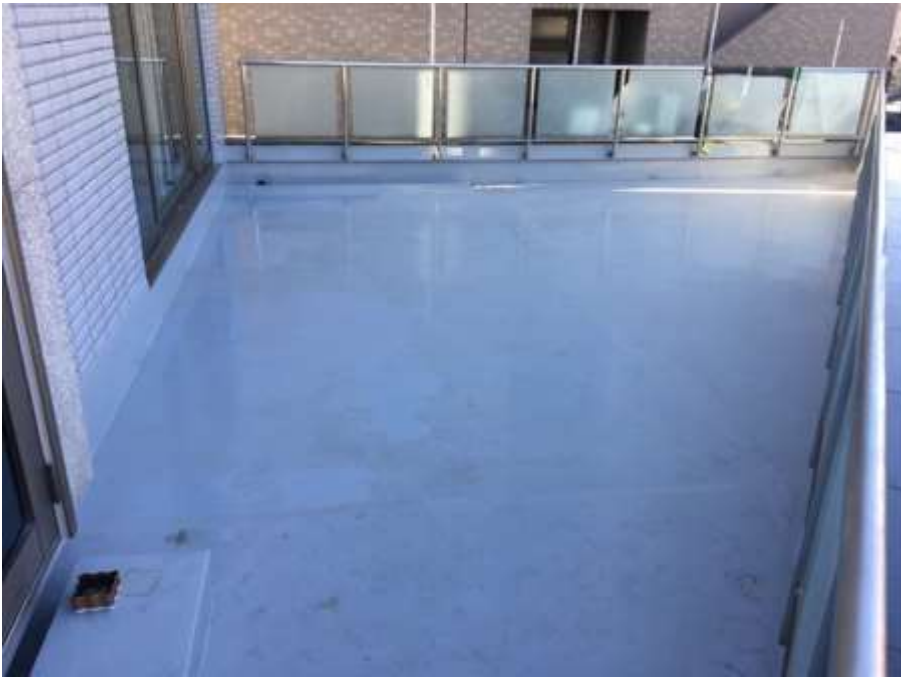
2階ルーフバルコニー 完了②