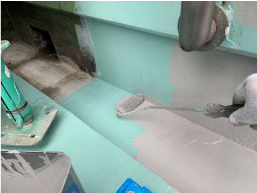
2階ルーフバルコニー 立上り トップコート塗布