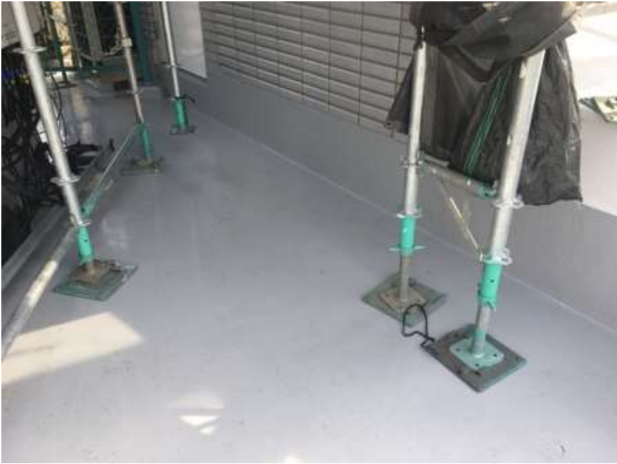
3階ルーフバルコニー トップコート塗布 完了