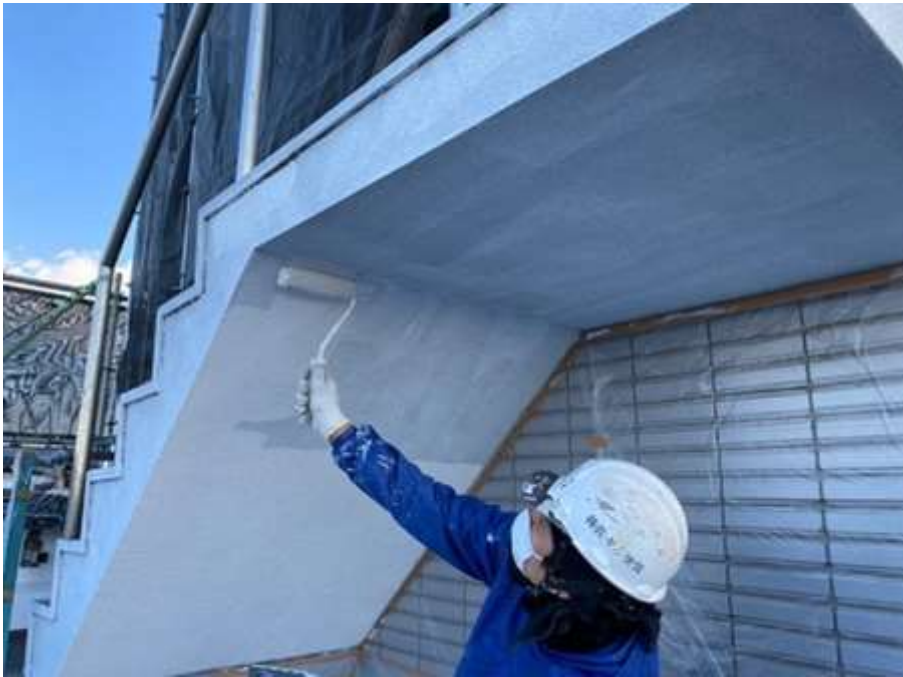
屋上塔屋階段段裏 及びササラ 中塗り