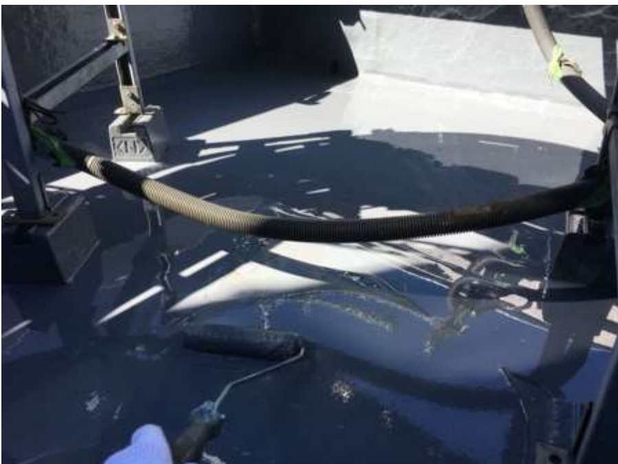
4階ルーフバルコニー 平場 高強度型ウレタン 二層目