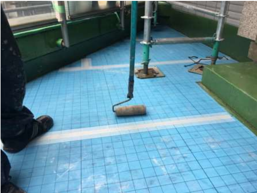
2階ルーフバルコニー 通気緩衝シート 貼付け