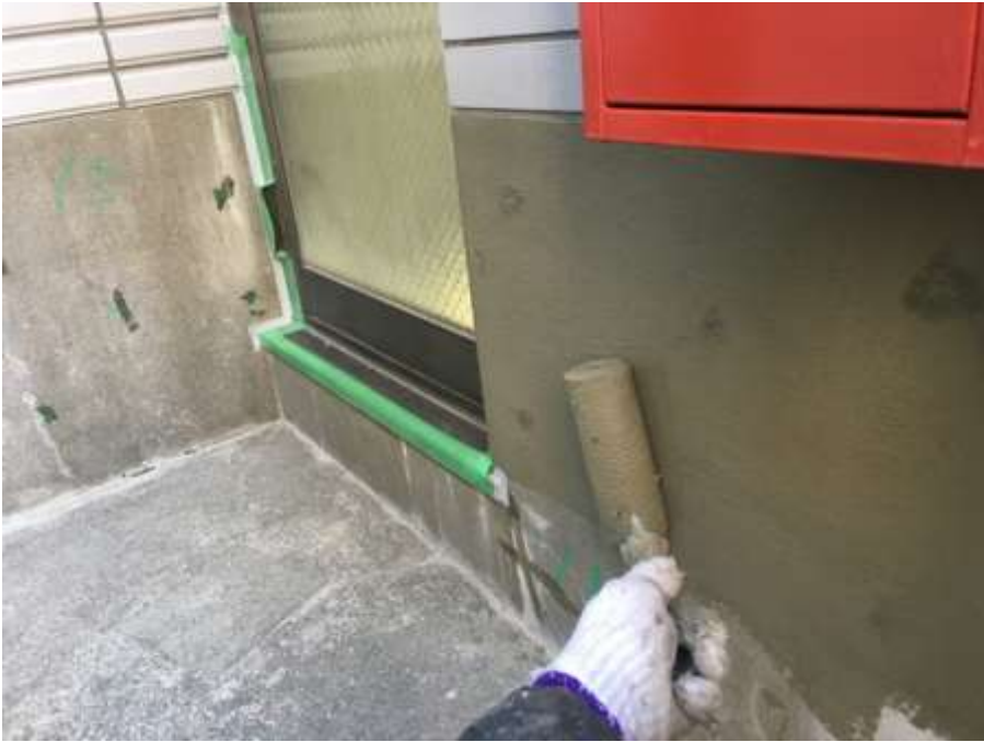
3階ルーフバルコニー 立上り 樹脂モルタル塗布