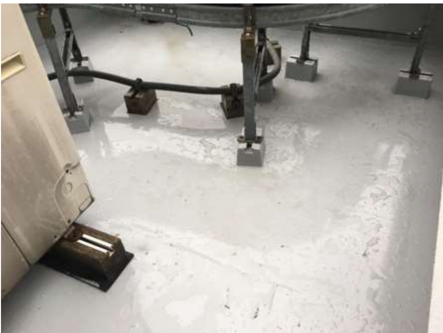
4階ルーフバルコニー 完了①