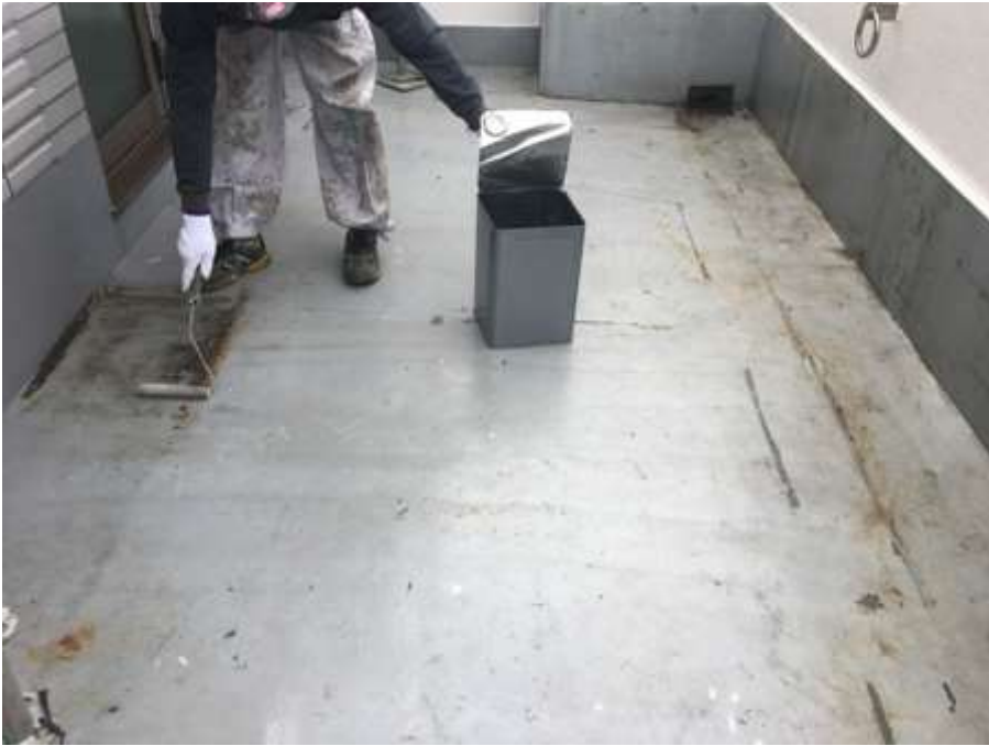
6階ルーフバルコニー プライマー塗布