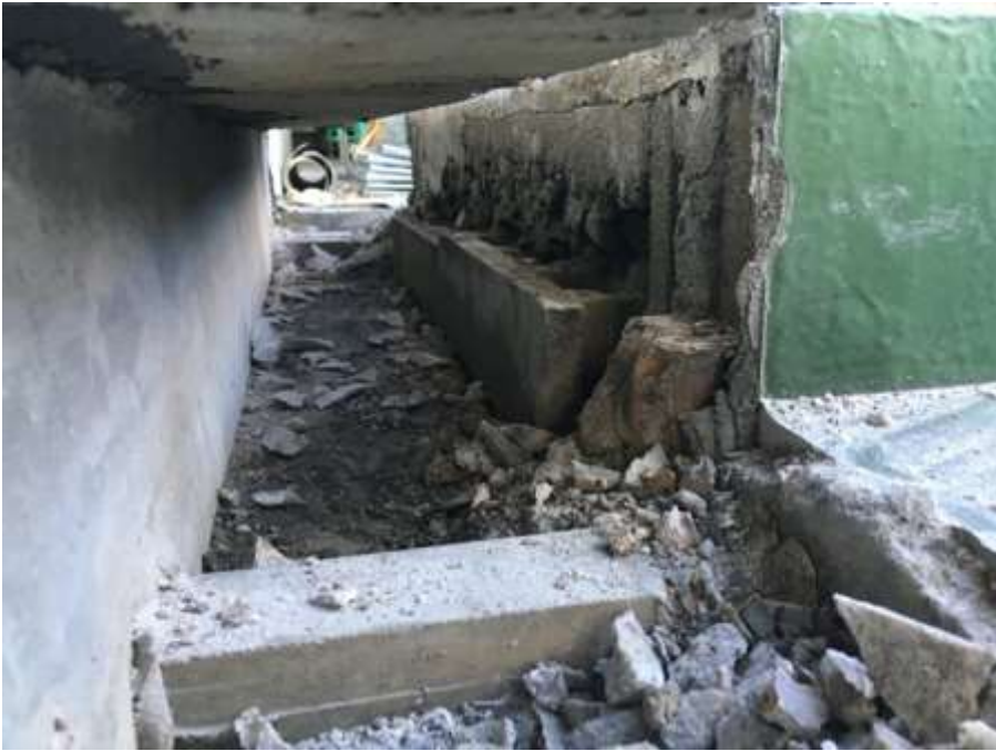
2階ルーフバルコニー カーテンウォール部 撤去後状況