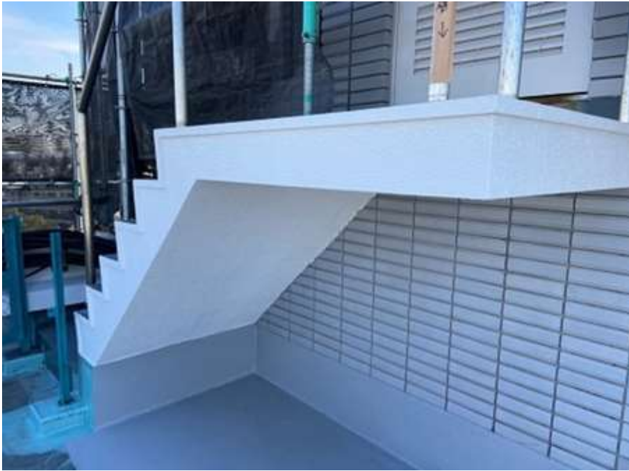
屋上塔屋階段段裏 及びササラ 完了