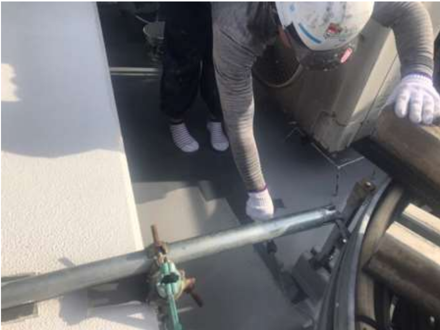
4階ルーフバルコニー 平場 トップコート塗布