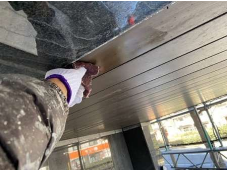
1階南車庫天井 アルミスパンドレイル 施工中