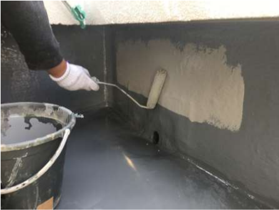
4階ルーフバルコニー 立上り トップコート塗布