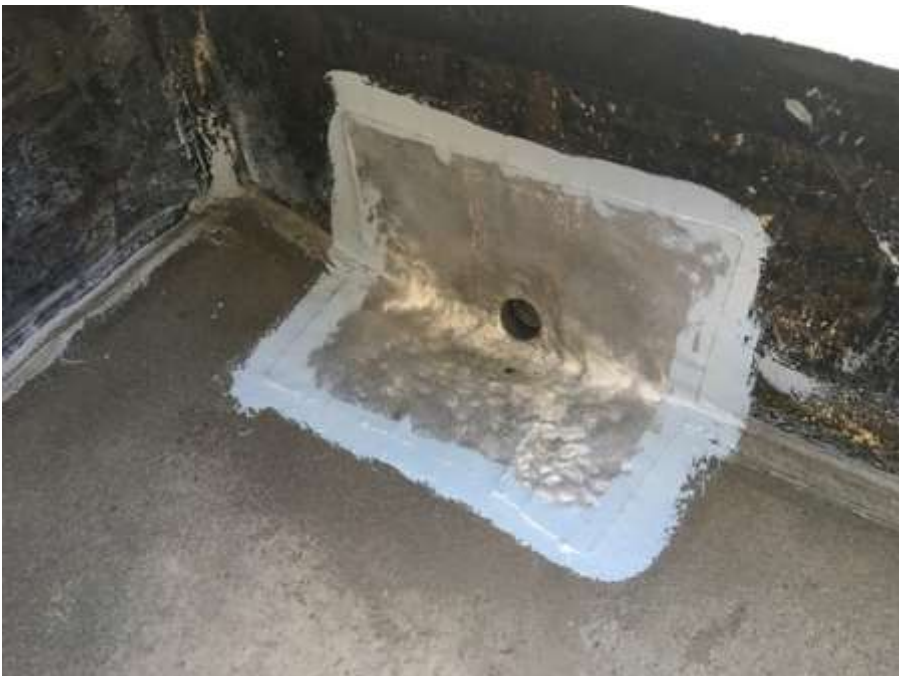
4階ルーフバルコニー 改修ドレン取付け