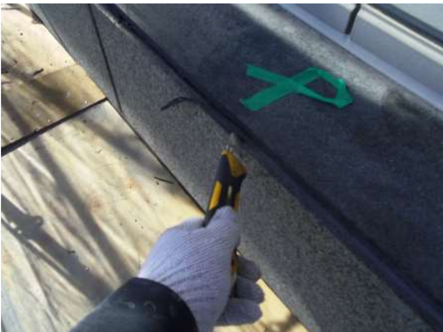
石目地撤去打替え 既存シーリング撤去