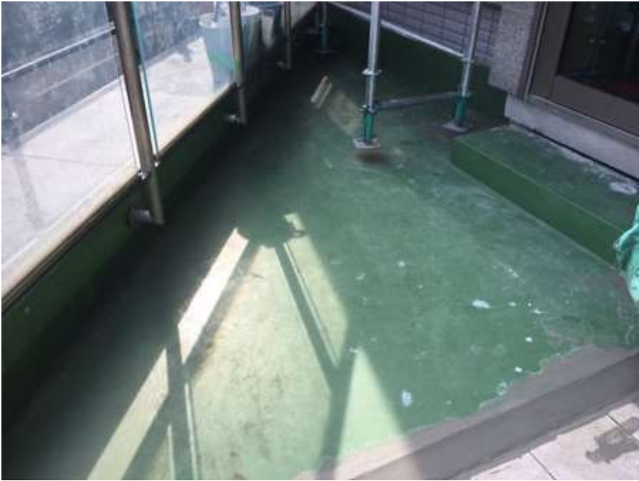
2階ルーフバルコニー 施工前②