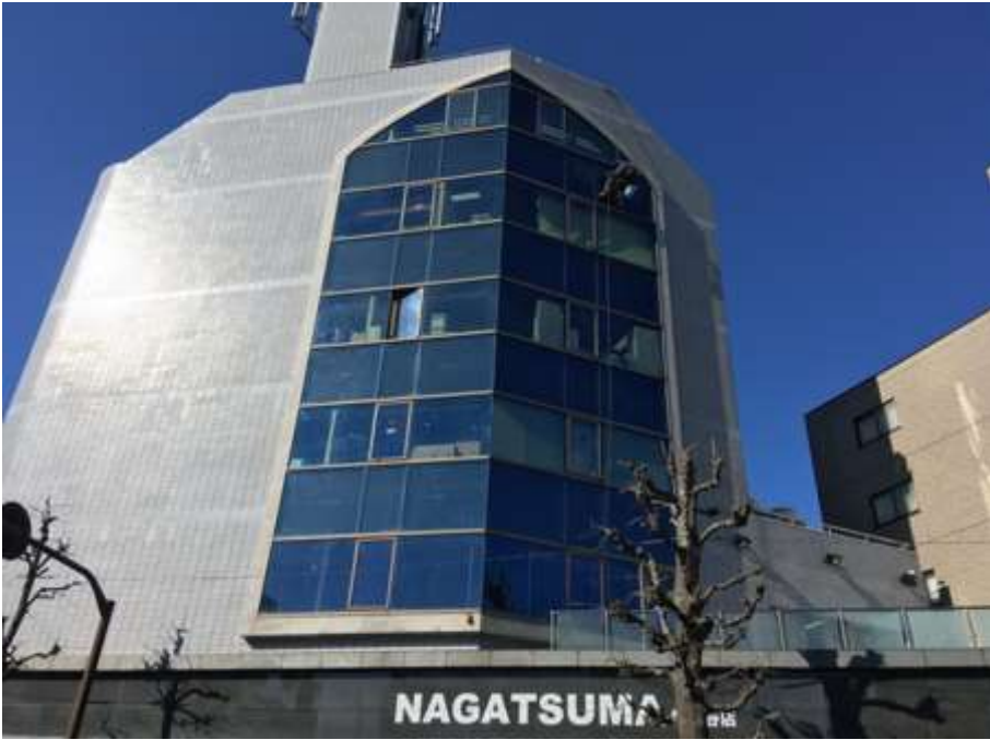
カーテンウォール 及びガラス清掃①