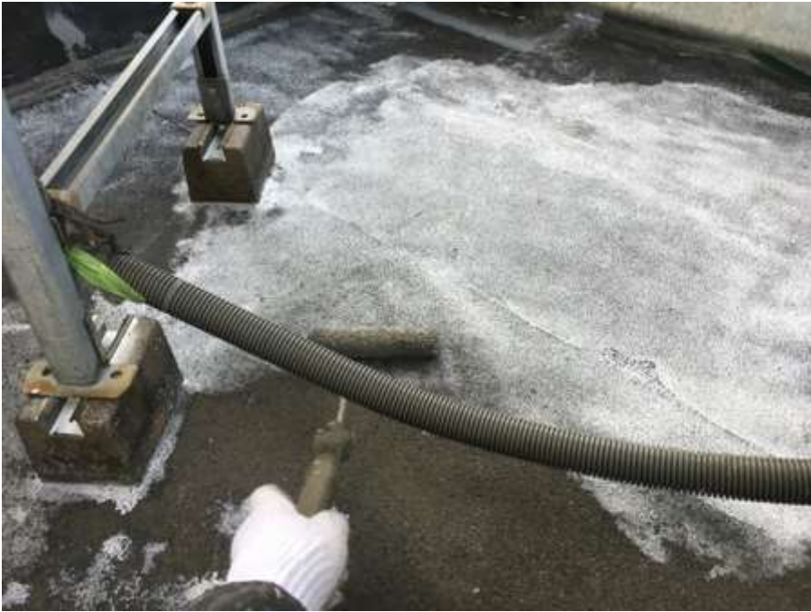
4階ルーフバルコニー プライマー塗布