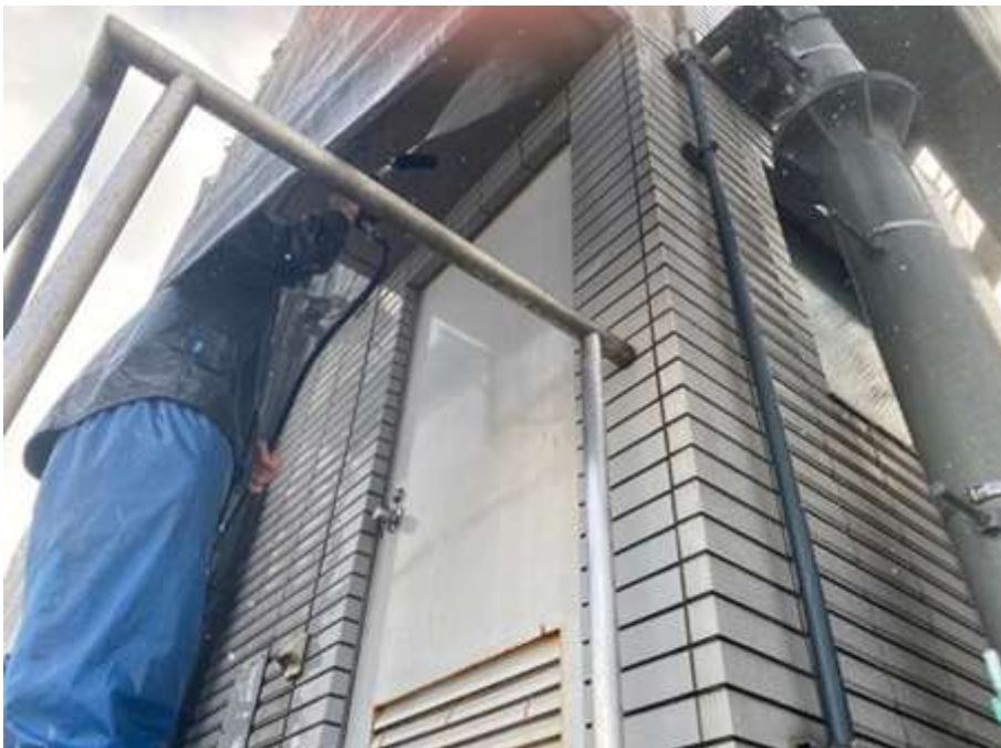
コンクリート底 高圧水洗浄