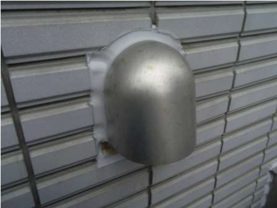
_____ ベントキャップ シーリング打替え 完了 _____ _____ _____ _____ _____ _____