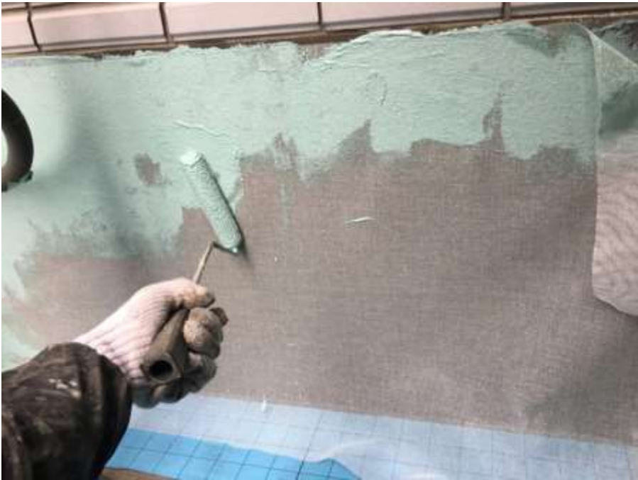
3階ルーフバルコニー 補強クロス貼付け