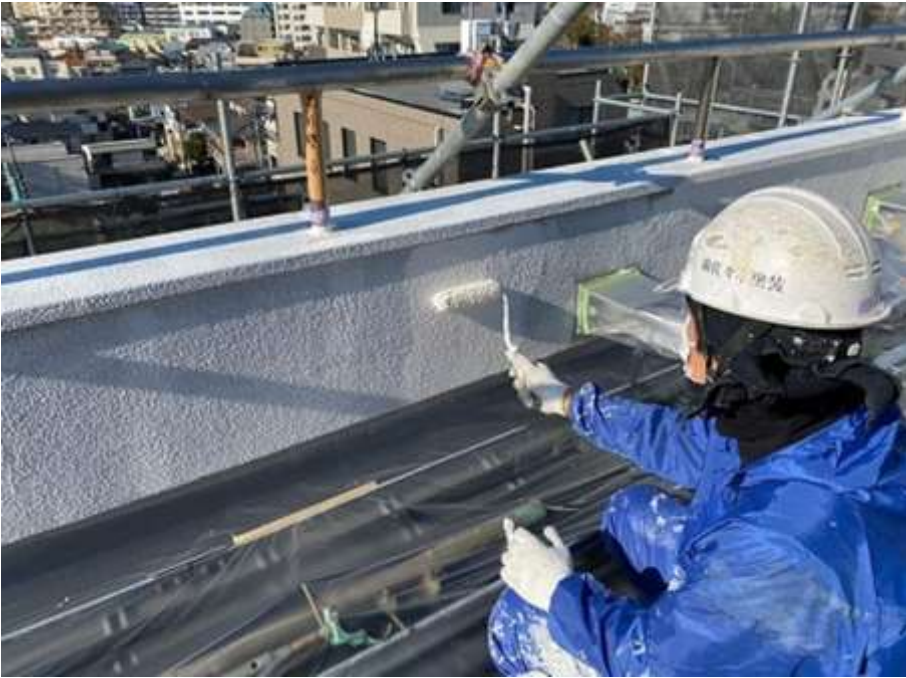
屋上パラペット 及び腰壁 中塗り