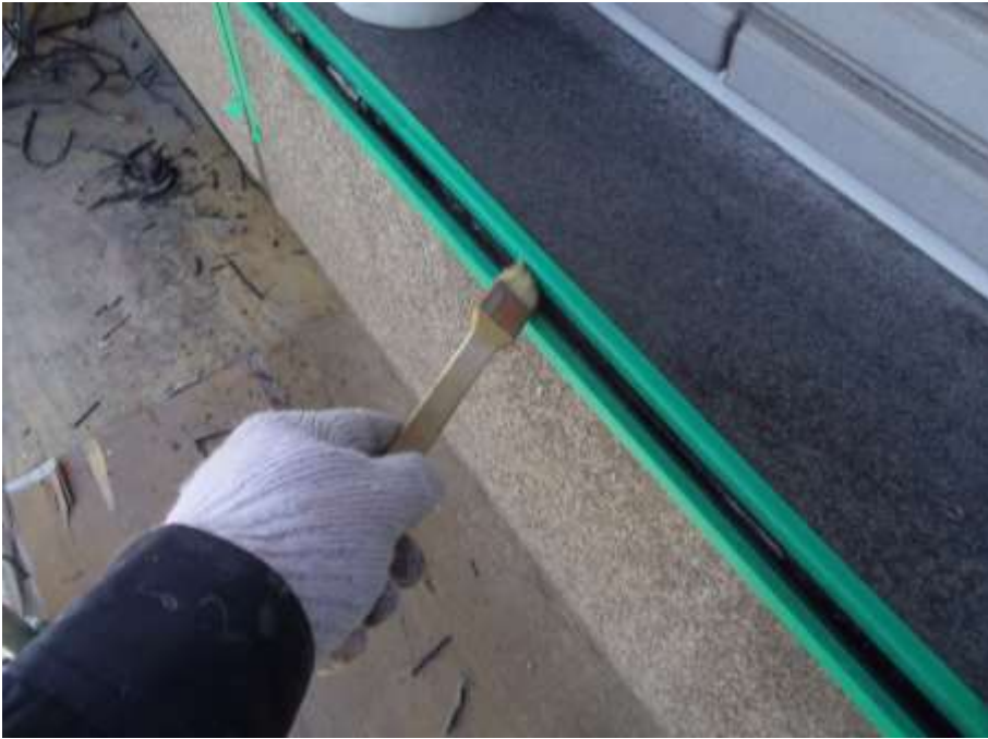
石目地撤去打替え プライマー塗布