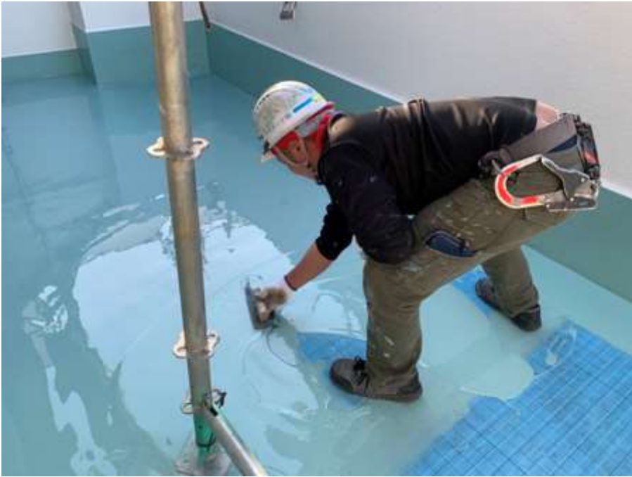
6階ルーフバルコニー 平場 高強度型ウレタン 一層目