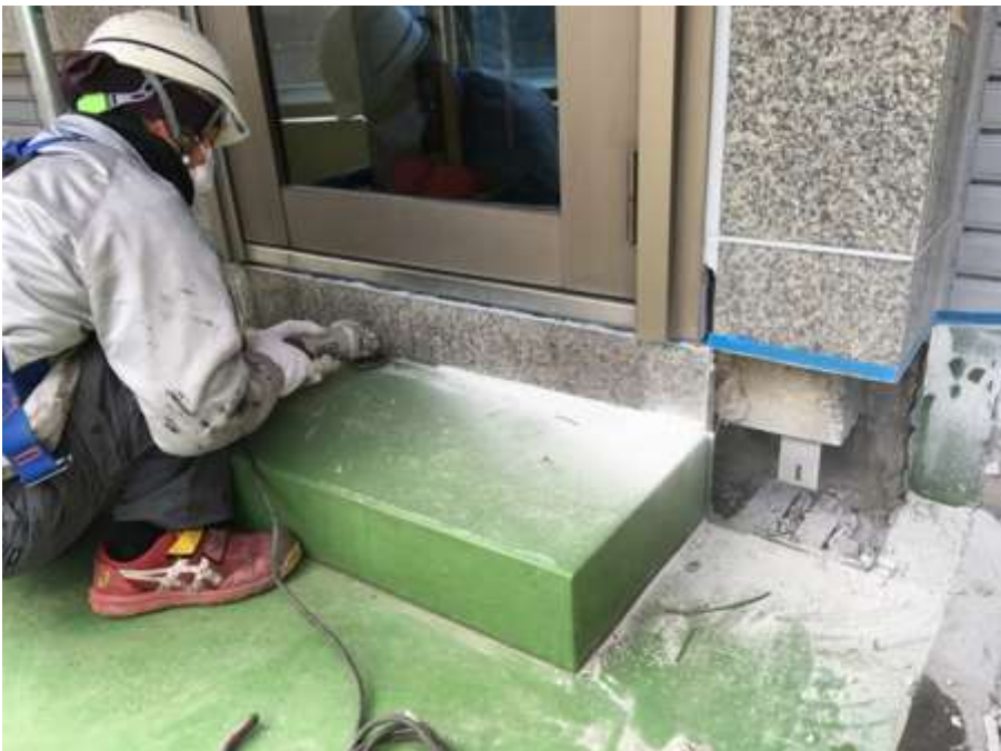
2階ルーフバルコニー カーテンウォール部 カッター入れ