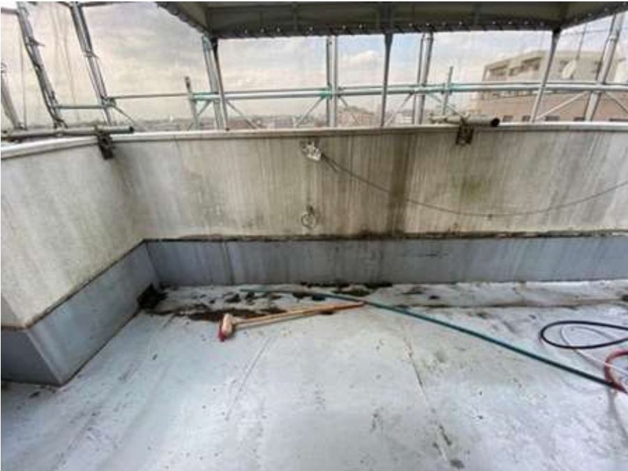
6階ルーフバルコニー 施工前