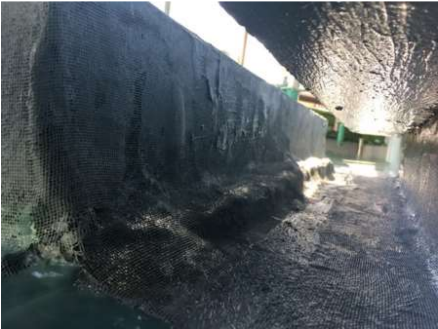
2階ルーフバルコニー カーテンウォール部 補強クロス貼付け