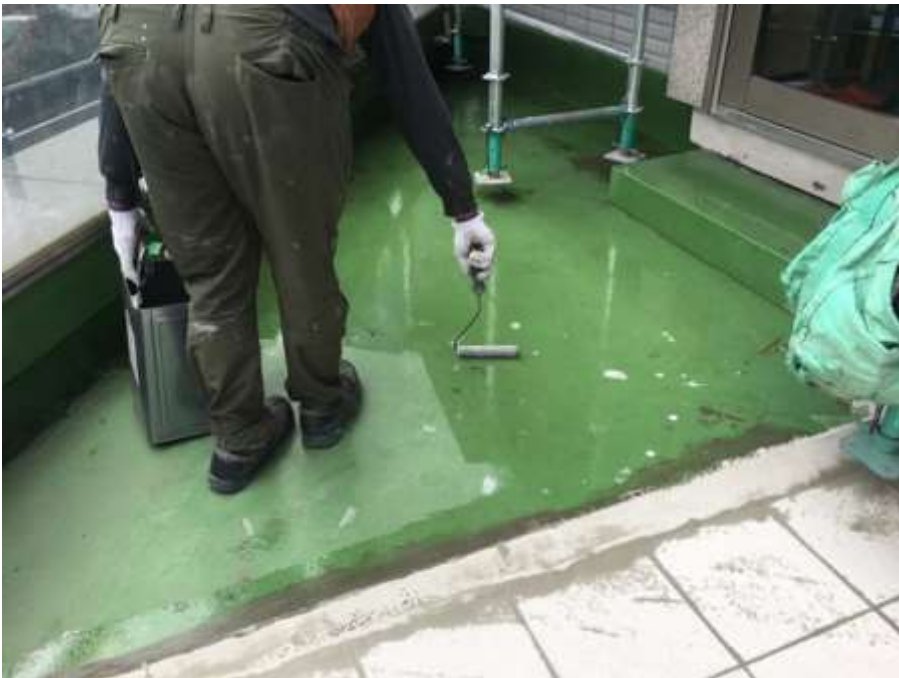
2階ルーフバルコニー プライマー塗布