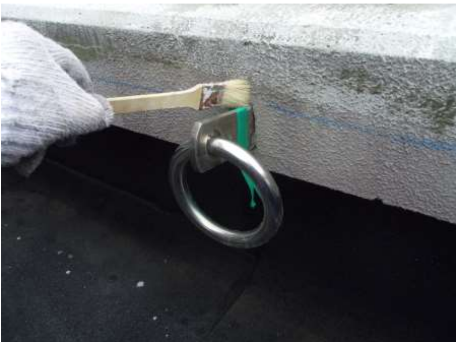
丸環根元 プライマー塗布