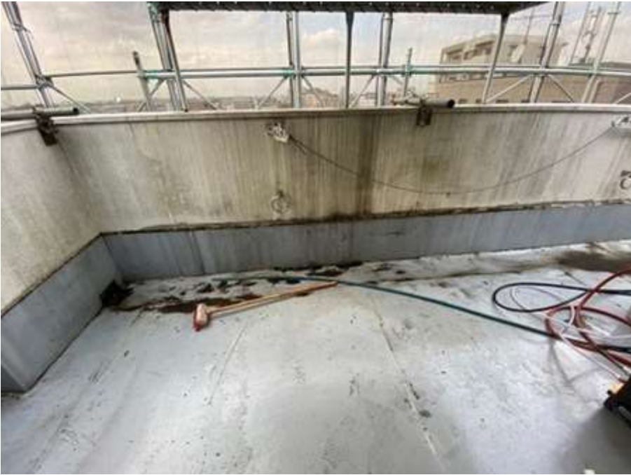
6階ルーフバルコニー 施工前