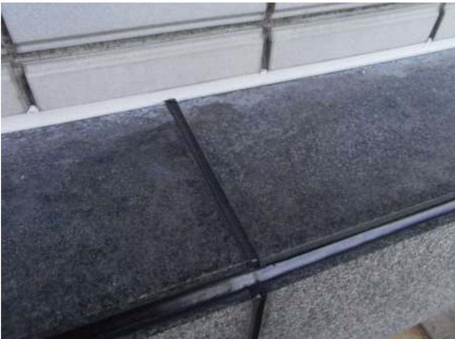
石目地撤去打替え 完了