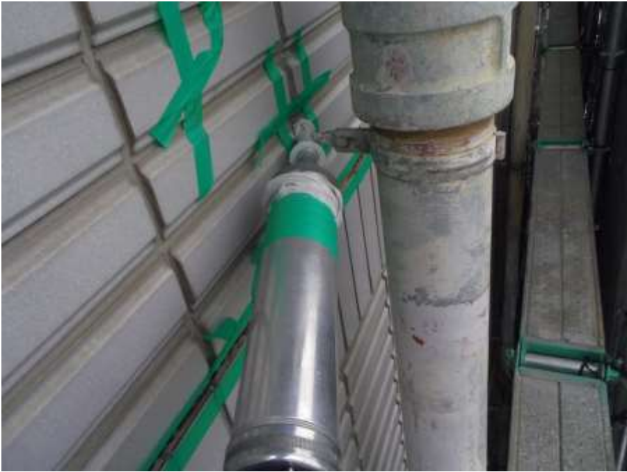
樋吊金物根元 新規シーリング充填