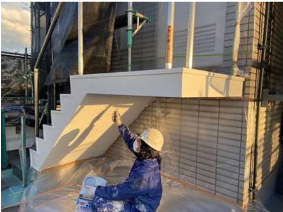
屋上塔屋階段段裏 及びササラ 上塗り