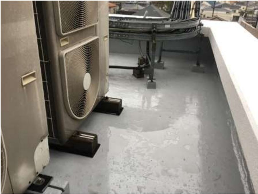
4階ルーフバルコニー 完了②