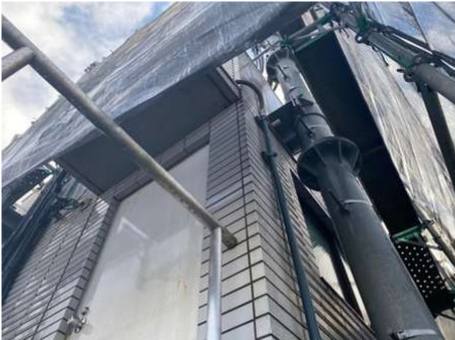
コンクリート底 施工前