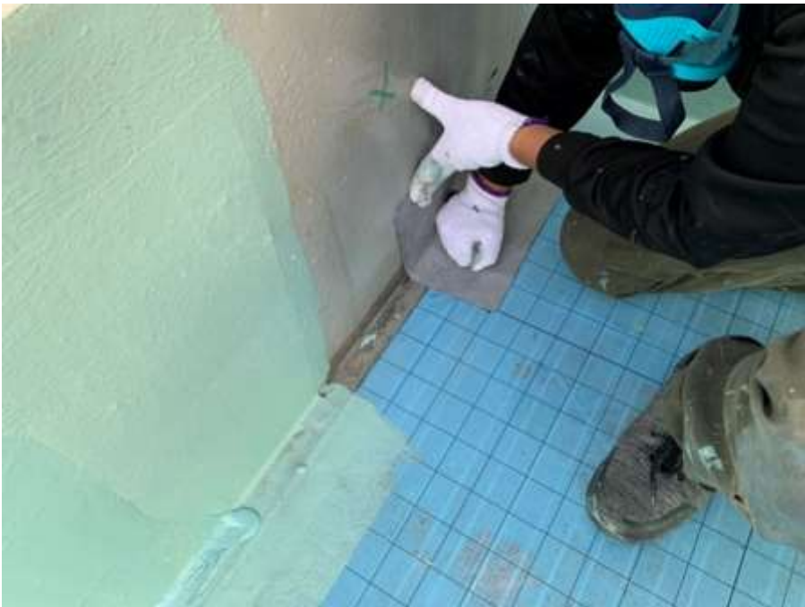
6階ルーフバルコニー 改修ドレン取付け