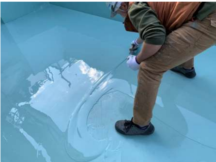
6階ルーフバルコニー 平場 高強度型ウレタン 二層目