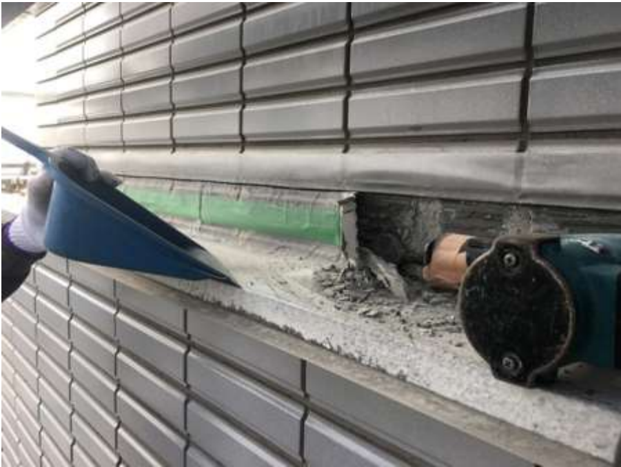
塔屋周囲タイル取合 タイル撤去