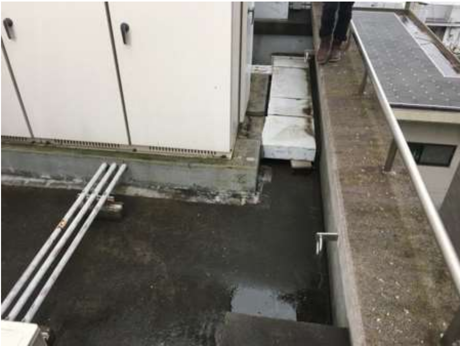
3階ルーフバルコニー 施工前①