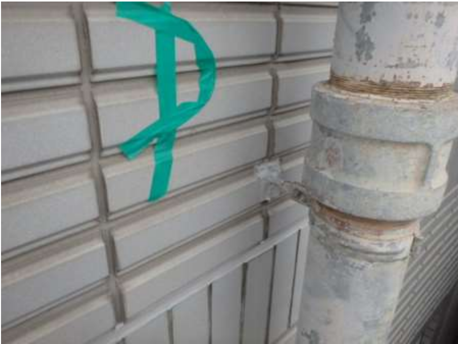
樋吊金物根元 完了