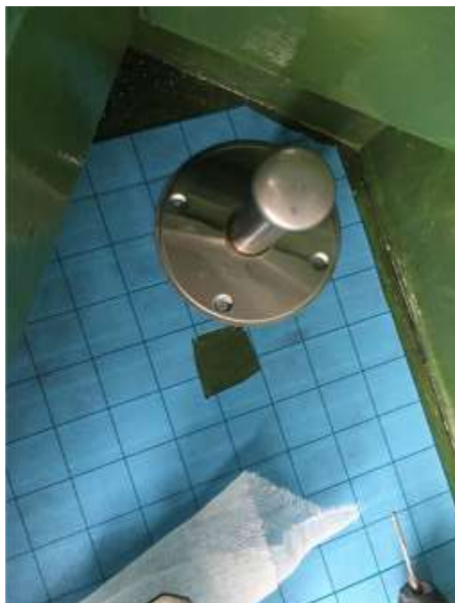
2階ルーフバルコニー 脱気筒取付け