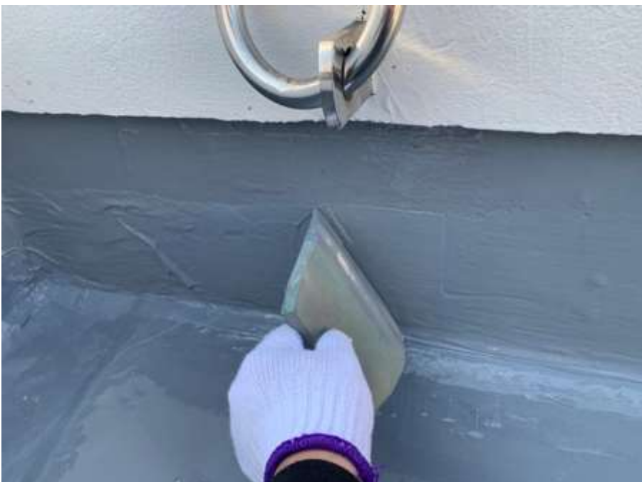
塔屋 立上り 高強度型ウレタン 二層目