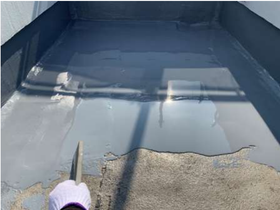
塔屋 平場 高強度型ウレタン 一層目