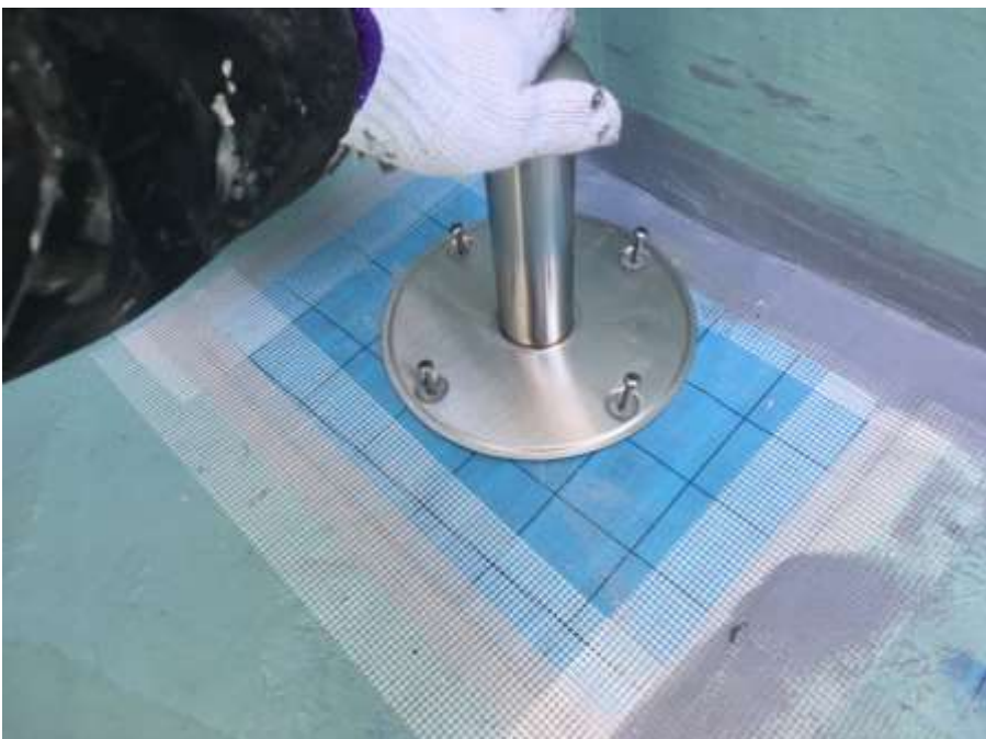
6階ルーフバルコニー 脱気筒取付け