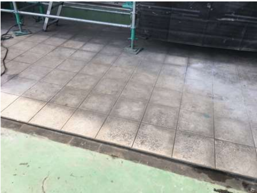
2階ルーフバルコニー 施工前①