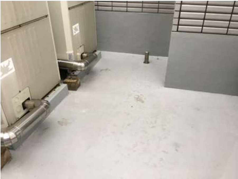
3階ルーフバルコニー 完了