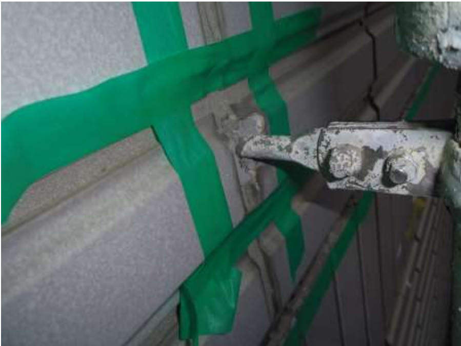
_____ 樋吊金物根元 施工前 _____ _____ _____ _____ _____ _____