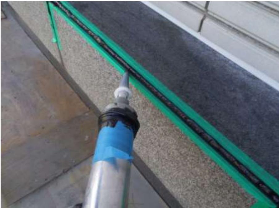
石目地撤去打替え 新規シーリング充填