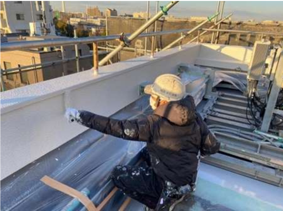
屋上パラペット 及び腰壁 上塗り