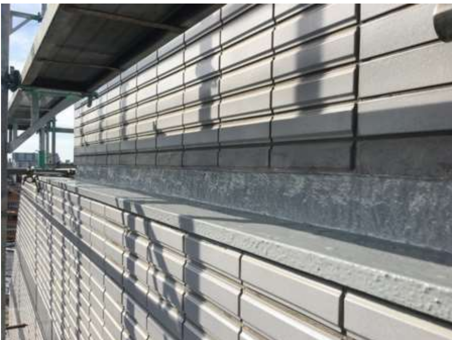
塔屋周囲タイル取合 完了