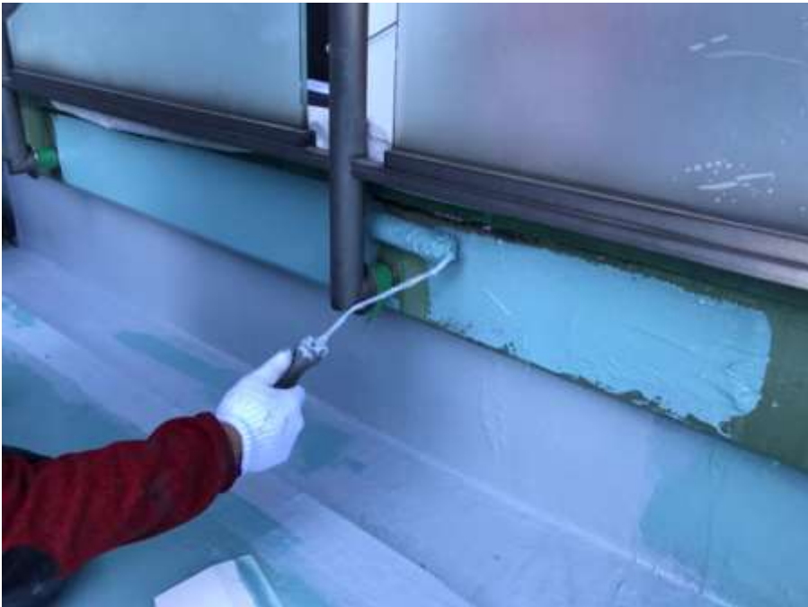
2階ルーフバルコニー 立上り 高強度型ウレタン 塗布