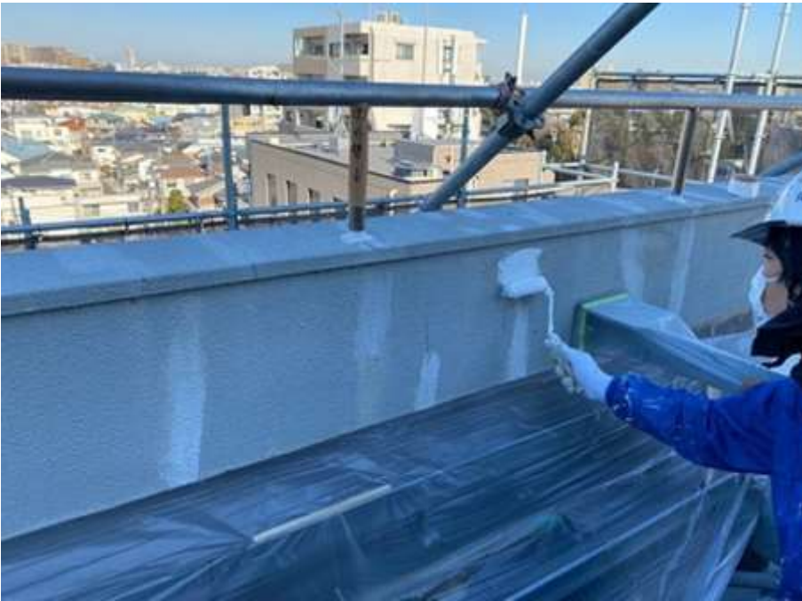
屋上パラペット 及び腰壁 パターン付け