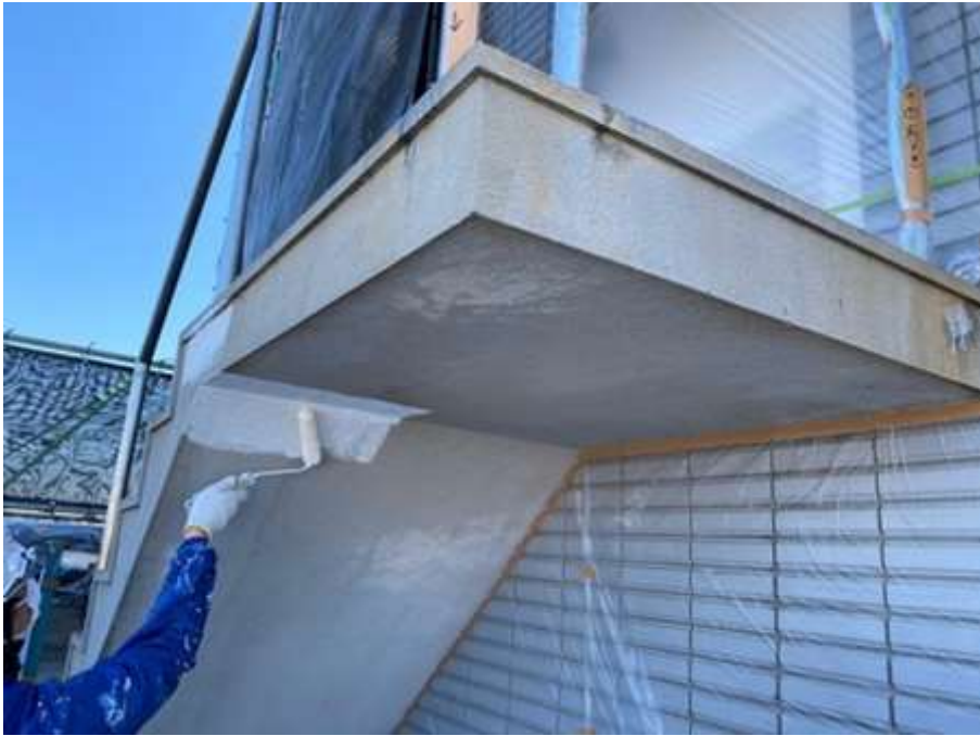
屋上塔屋階段段裏 及びササラ 下塗り