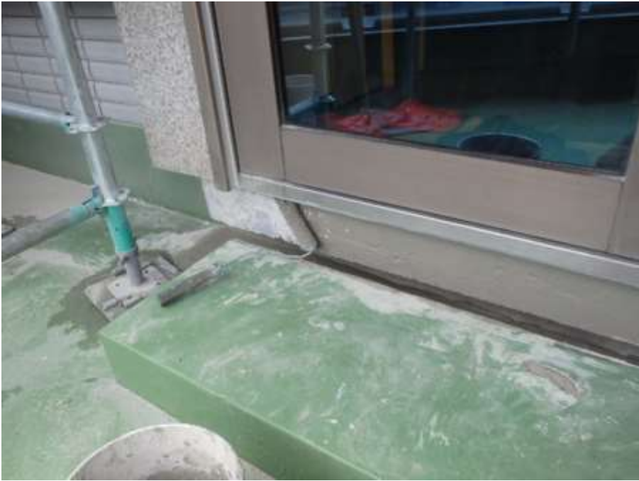
2階ルーフバルコニー カーテンウォール部 下地調整