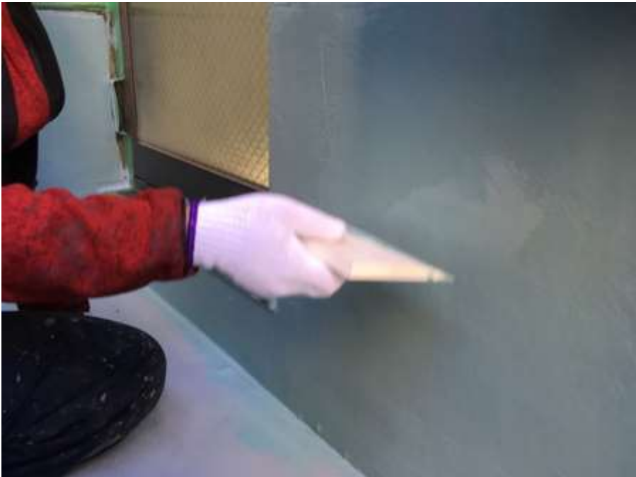
3階ルーフバルコニー 立上り 高強度型ウレタン 二層目