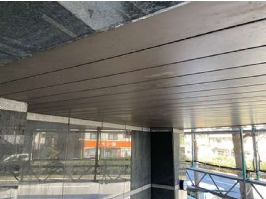
1階南車庫天井 アルミスパンドレイル 完了