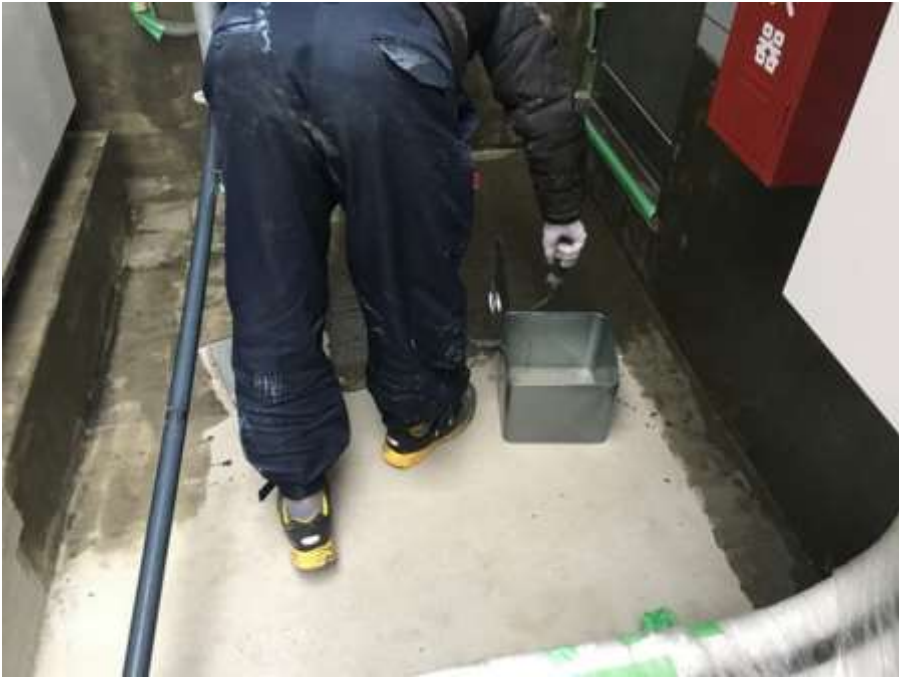
3階ルーフバルコニー 平場 プライマー塗布