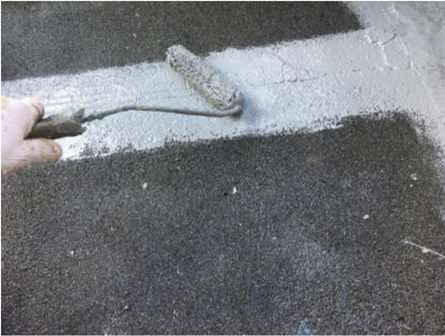
4階ルーフバルコニー 平場 高強度型ウレタン 一層目