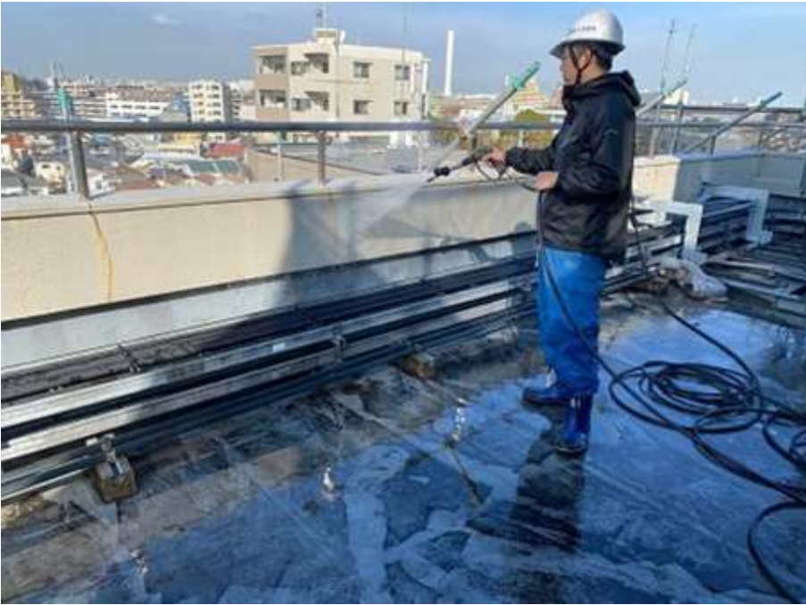
屋上パラペット 及び腰壁 高圧水洗浄