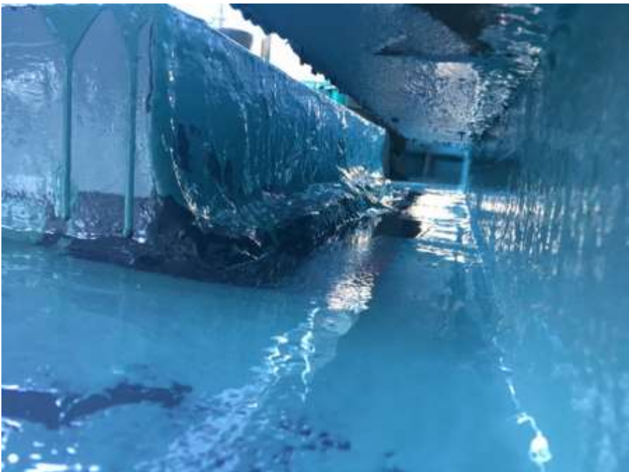
2階ルーフバルコニー カーテンウォール部 高強度型ウレタン