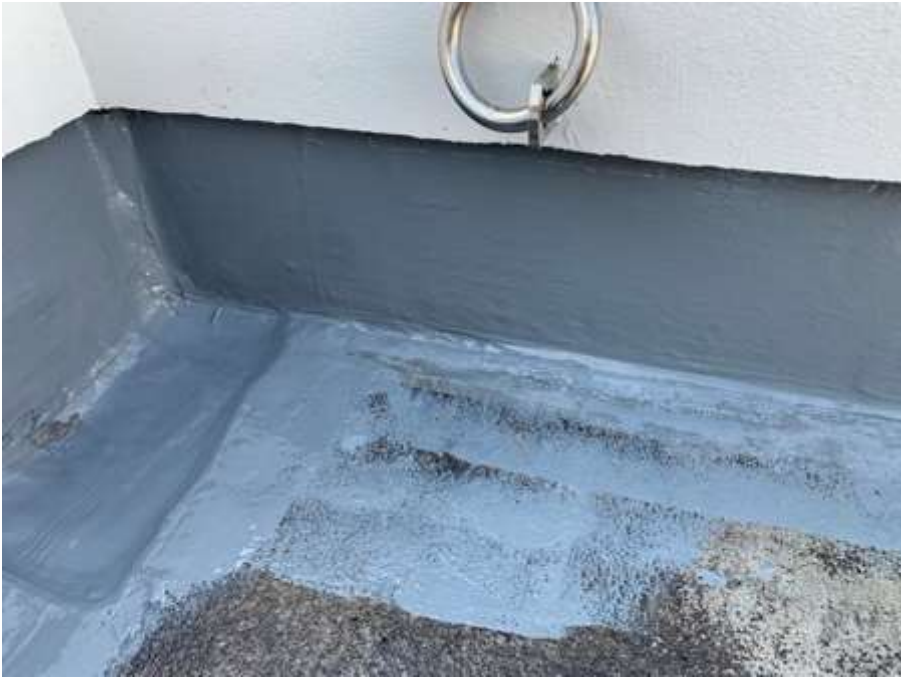
塔屋 立上り 高強度型ウレタン 一層目