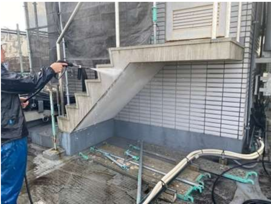
屋上塔屋階段段裏 及びササラ 高圧水洗浄