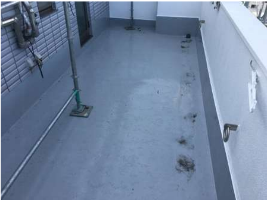
6階ルーフバルコニー 完了