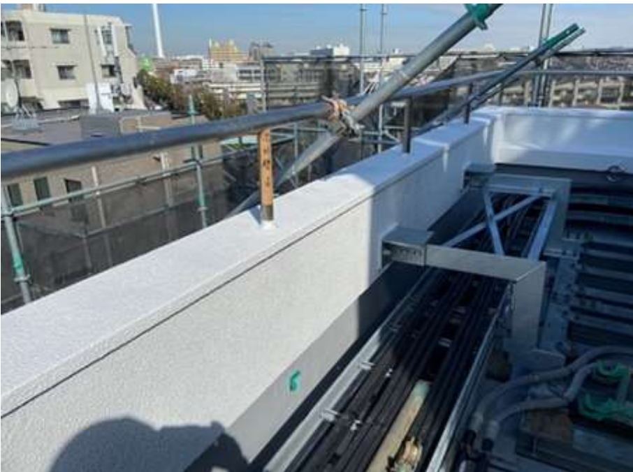
屋上パラペット 及び腰壁 完了