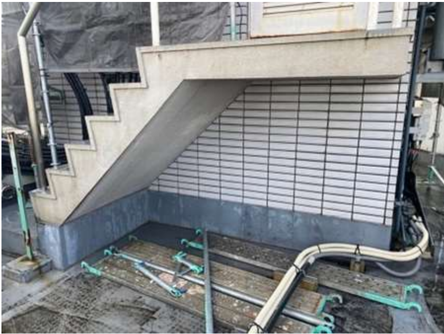
屋上塔屋階段段裏 及びササラ 施工前