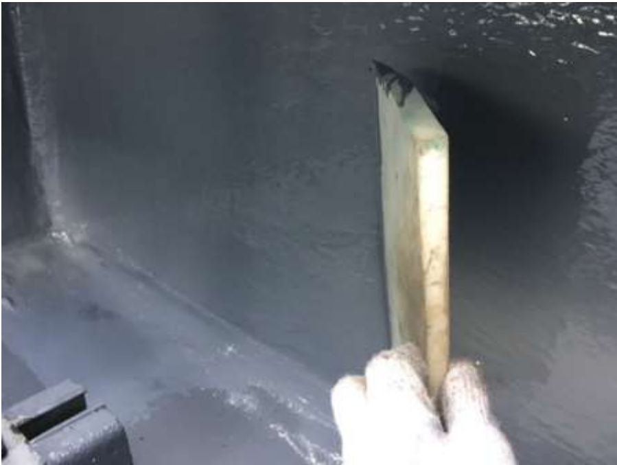
4階ルーフバルコニー 立上り 高強度型ウレタン 二層目