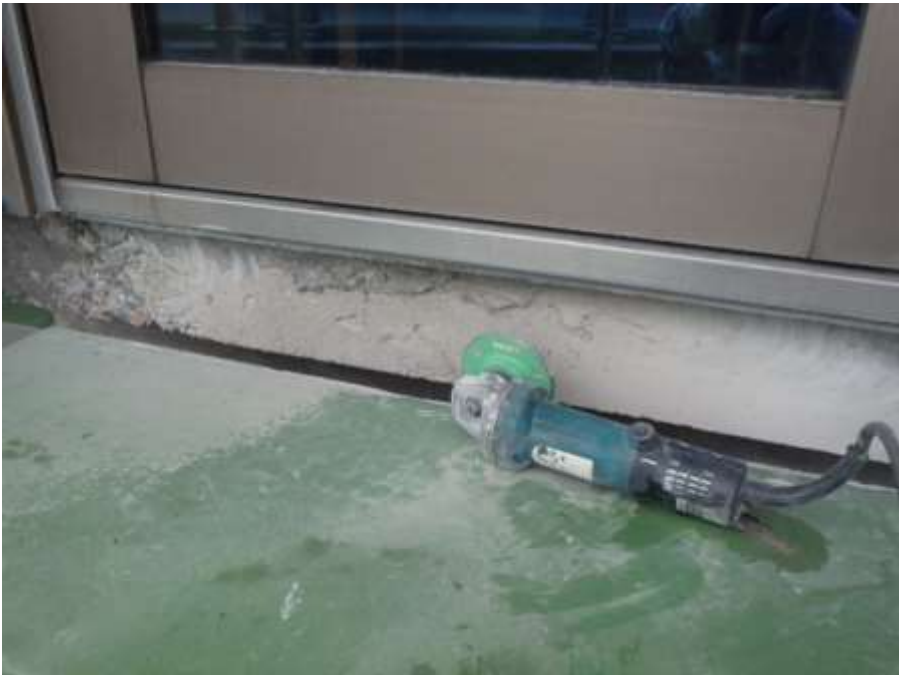
2階ルーフバルコニー カーテンウォール部 サンディング