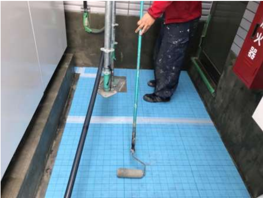
3階ルーフバルコニー 通気緩衝シート 貼付け