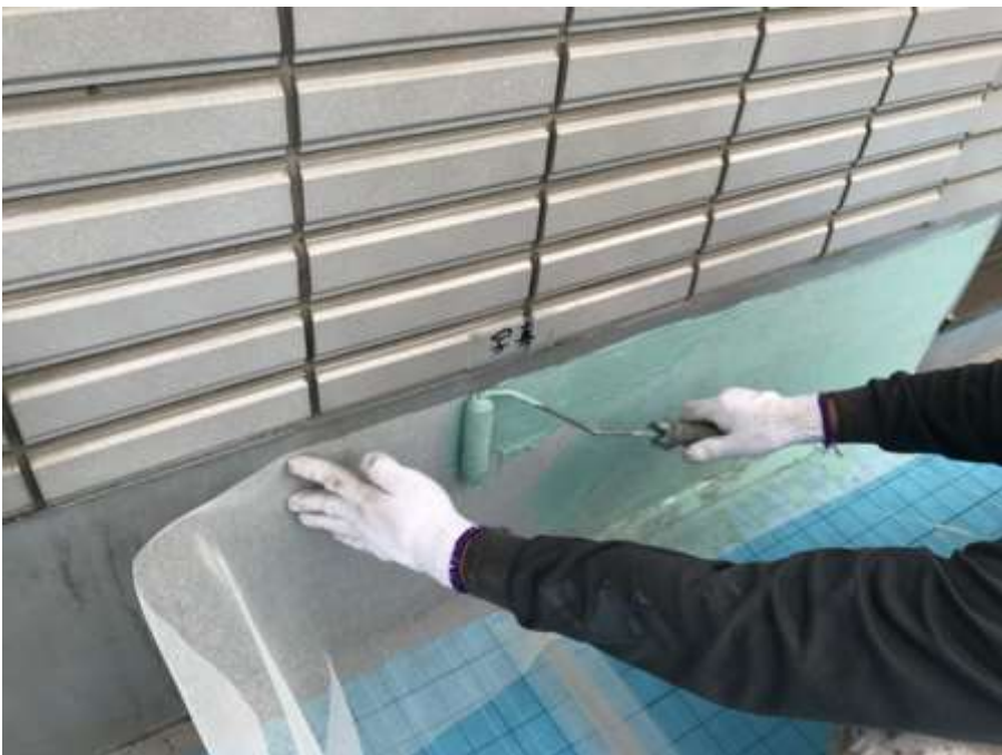
6階ルーフバルコニー 補強クロス貼付け