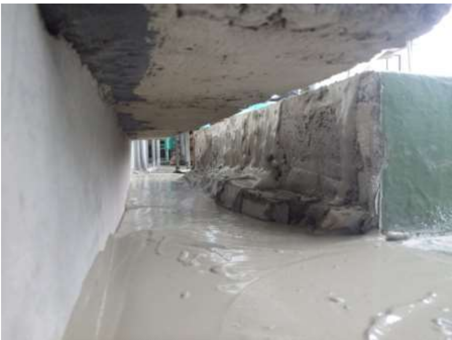
2階ルーフバルコニー カーテンウォール部 不陸調整