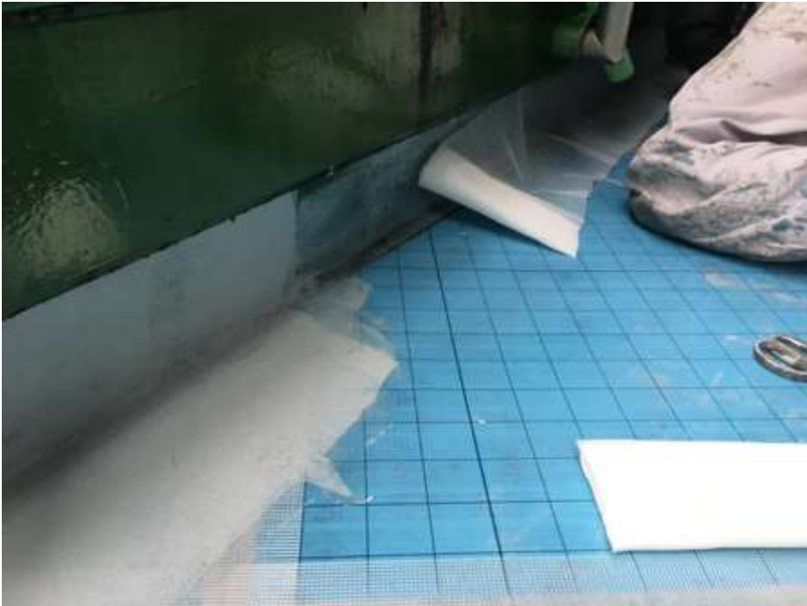
2階ルーフバルコニー 補強クロス貼付け