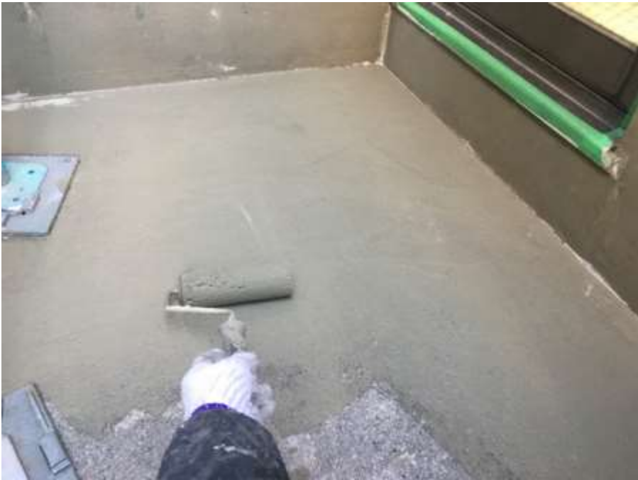
3階ルーフバルコニー 平場 樹脂モルタル塗布