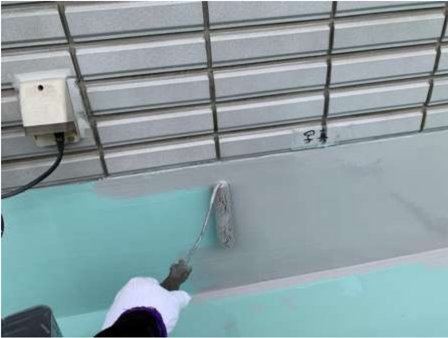
6階ルーフバルコニー 立上り トップコート塗布