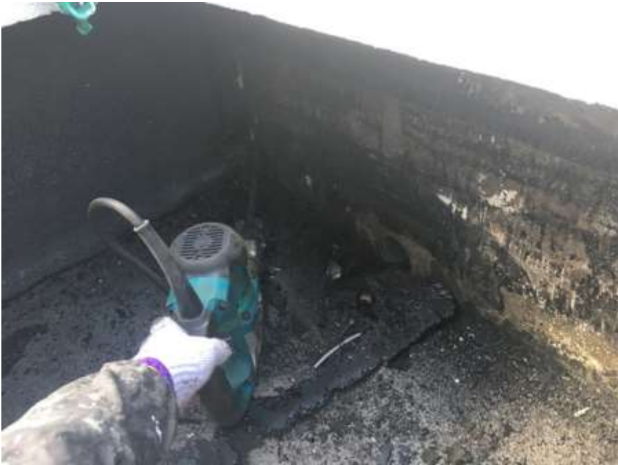
4階ルーフバルコニー 立上り既存シート 撤去