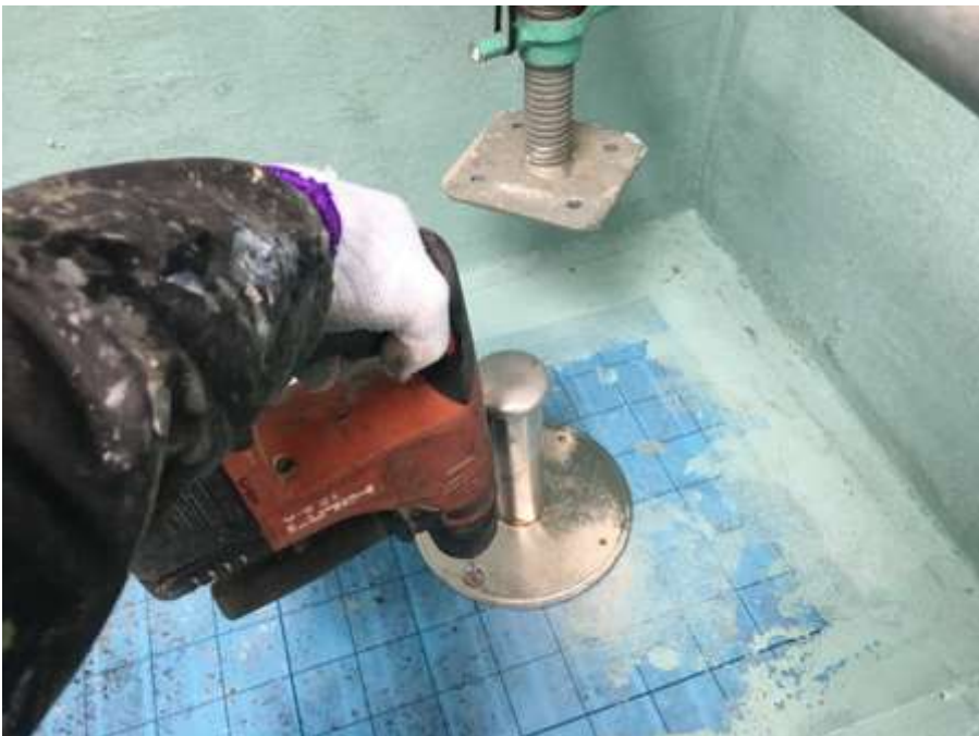
3階ルーフバルコニー 脱気筒取付け