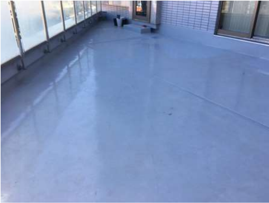
2階ルーフバルコニー 完了①