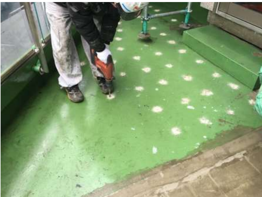
2階ルーフバルコニー ランダム穿孔