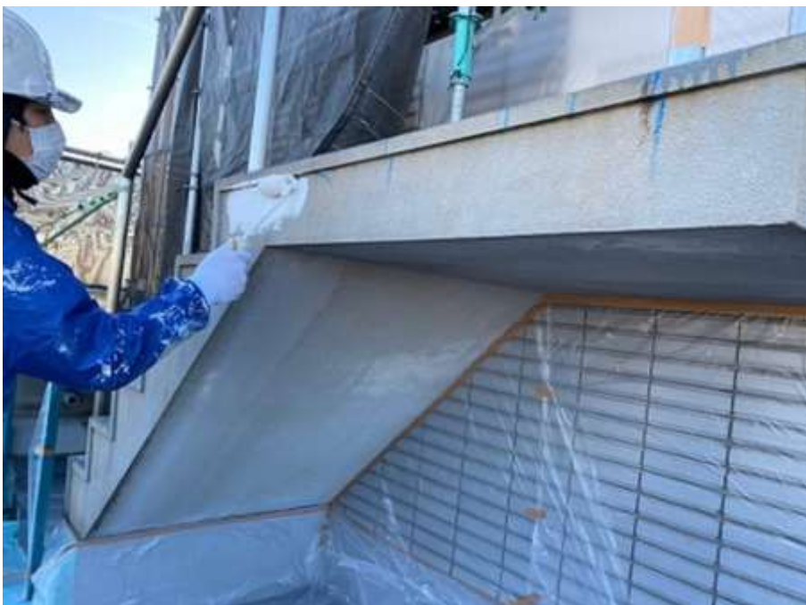
屋上塔屋階段段裏 及びササラ パターン付け