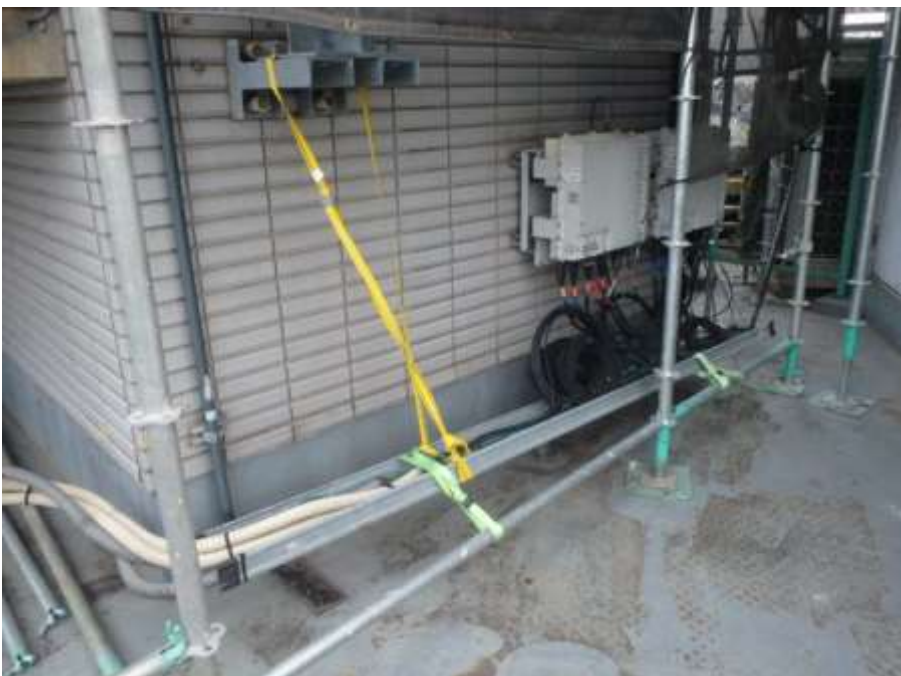
屋上 アンテナ基地局 揚げ養生②