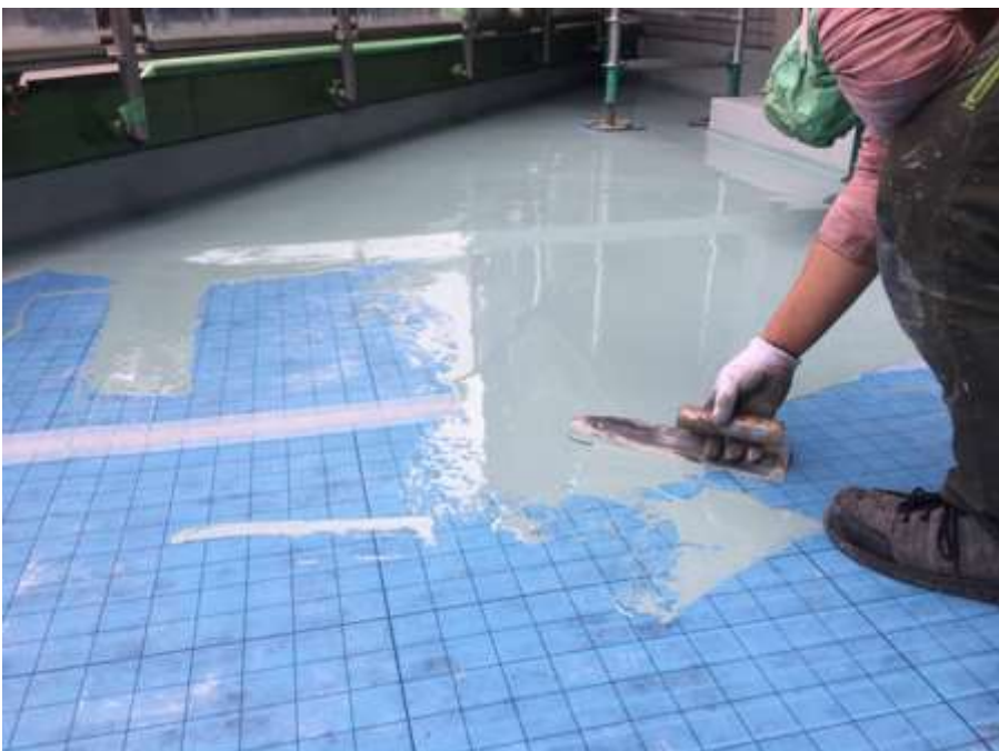
2階ルーフバルコニー 平場 高強度型ウレタン 一層目