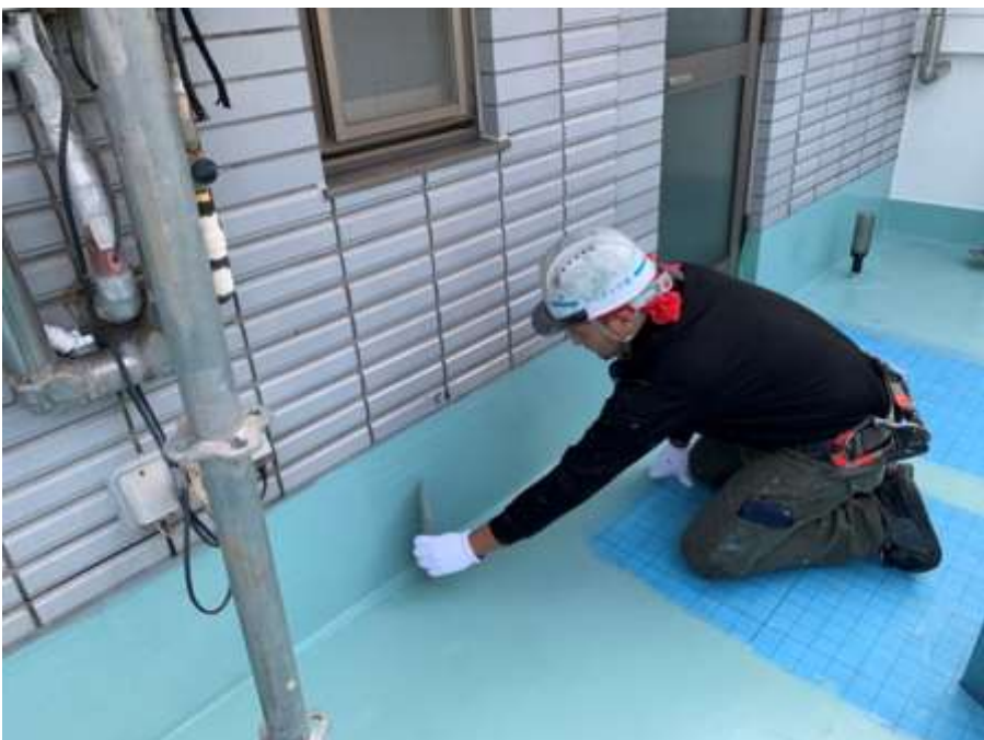
6階ルーフバルコニー 立上り 高強度型ウレタン 一層目