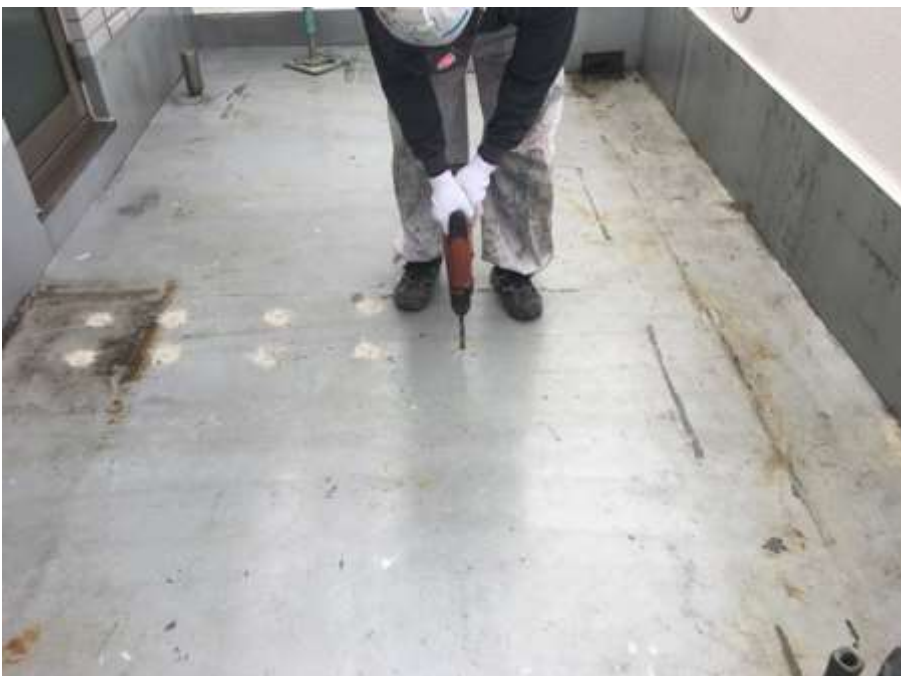
6階ルーフバルコニー ランダム穿孔