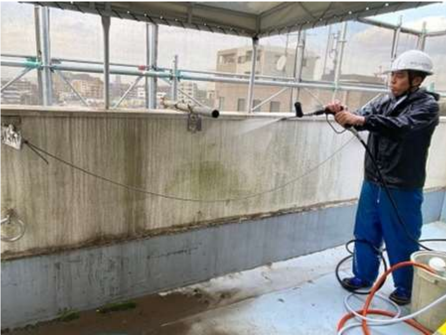
6階ルーフバルコニー 高圧水洗浄