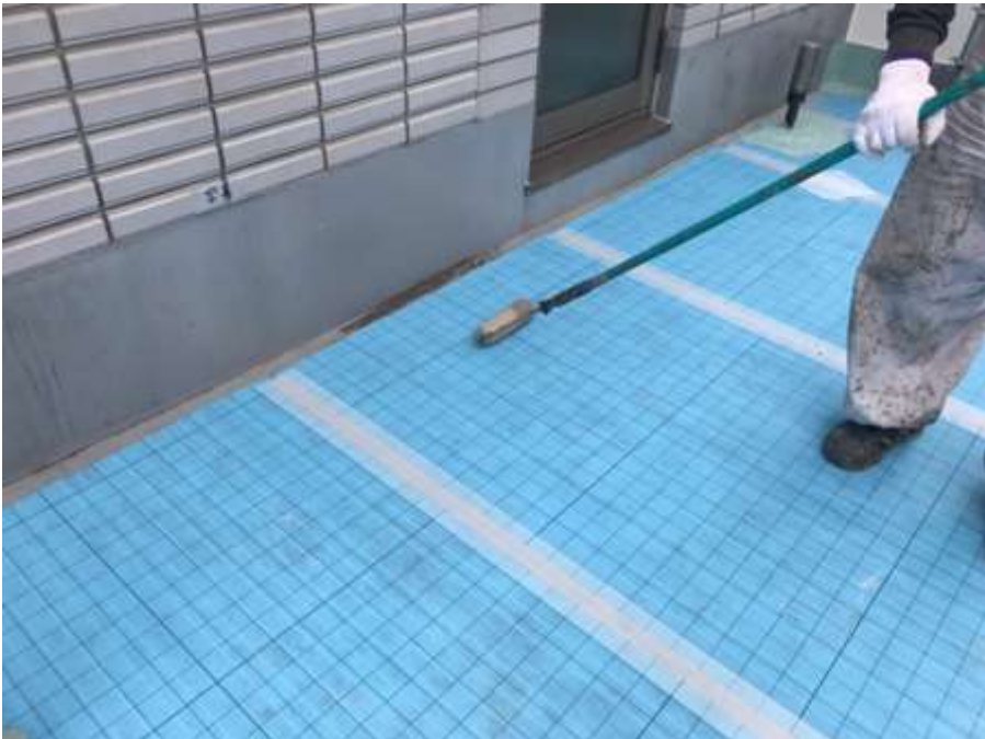
6階ルーフバルコニー 通気緩衝シート 貼付け