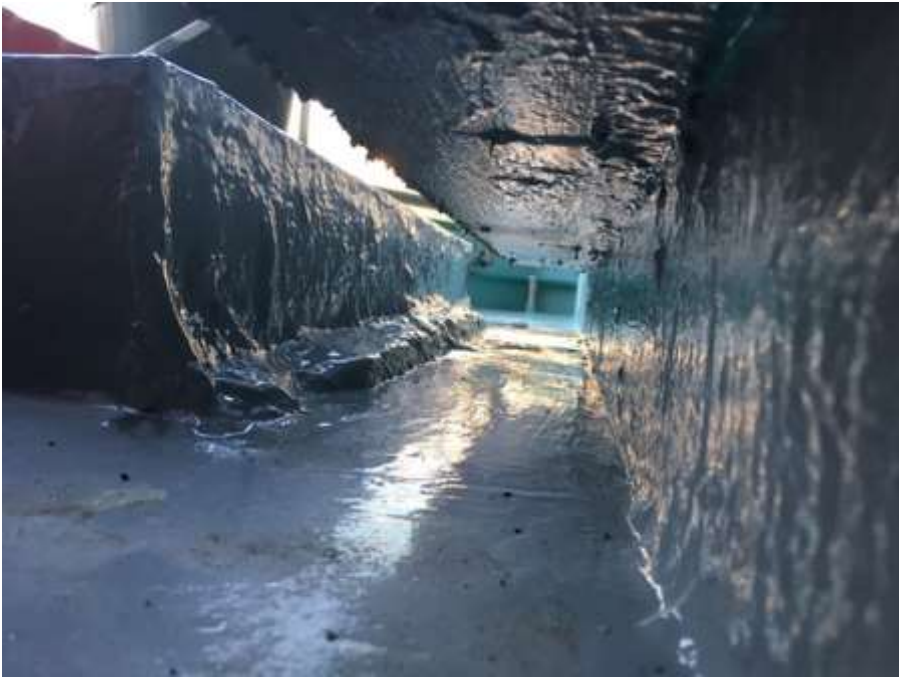
2階ルーフバルコニー カーテンウォール部 トップコート塗布