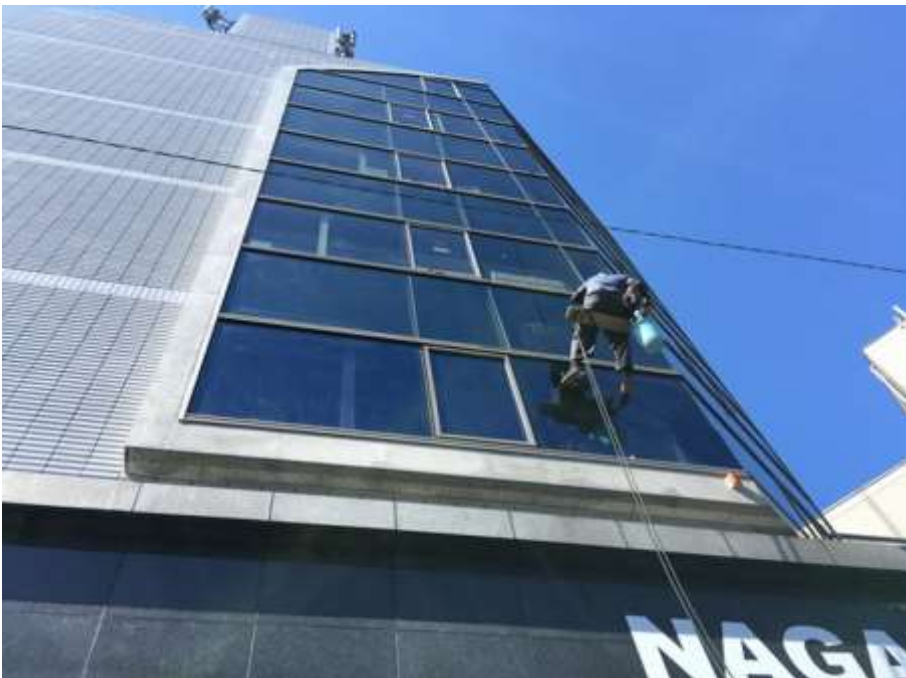
カーテンウォール 及びガラス清掃③