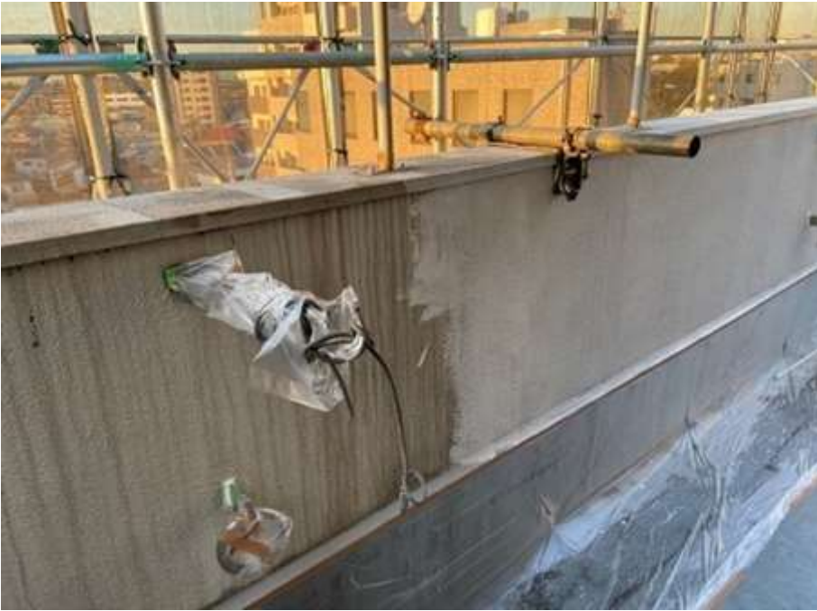
6階ルーフバルコニー 下塗り