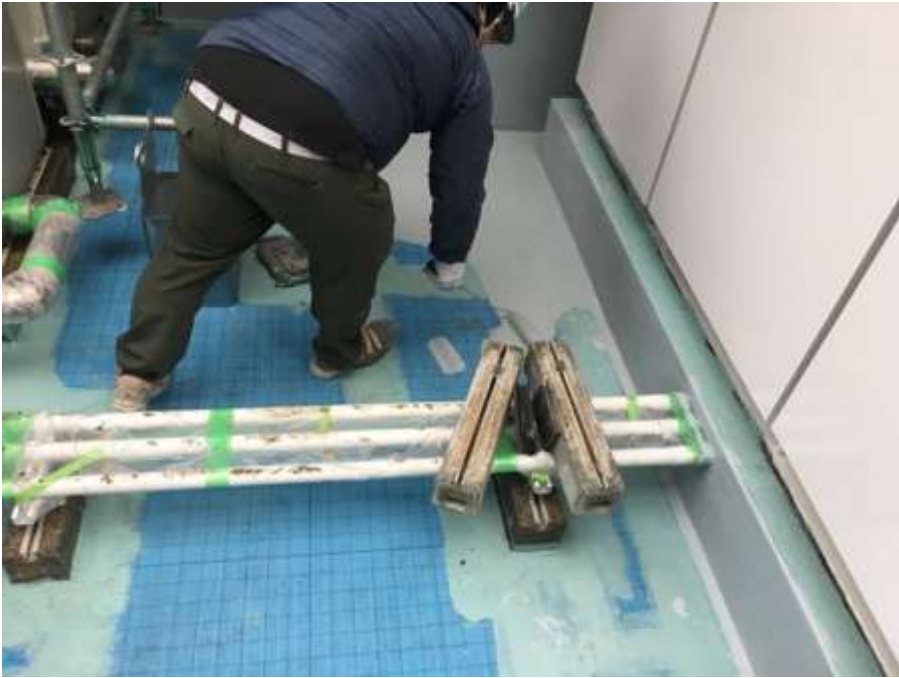
3階ルーフバルコニー 平場 高強度型ウレタン 一層目