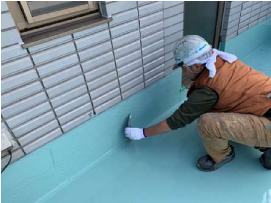
6階ルーフバルコニー 立上り 高強度型ウレタン 二層目