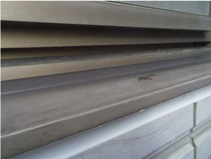
サッシュ水切り上部 完了