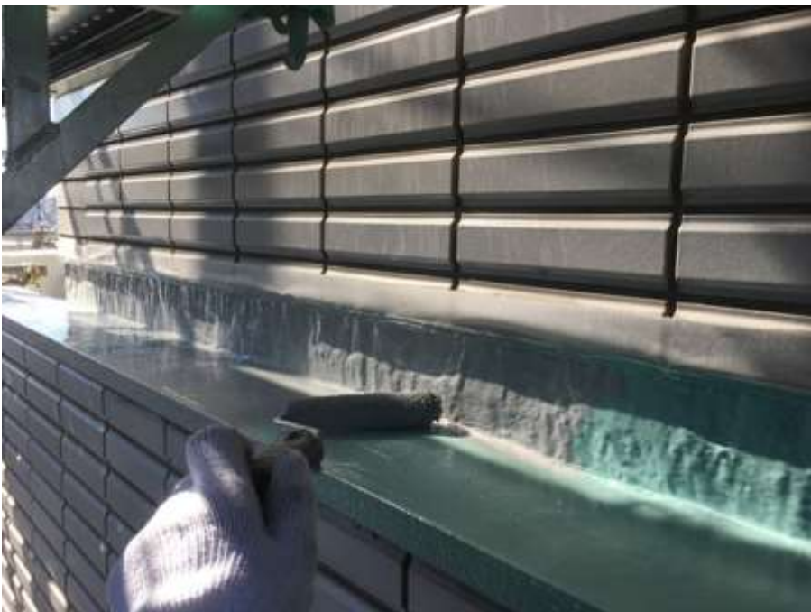
塔屋周囲タイル取合 トップコート塗布