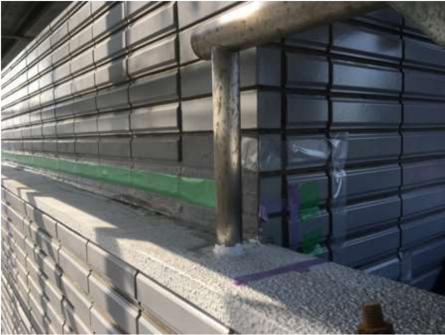
塔屋周囲タイル取合 施工前