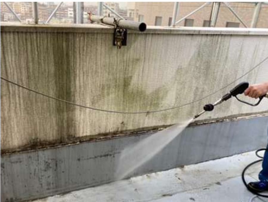
6階ルーフバルコニー 高圧水洗浄