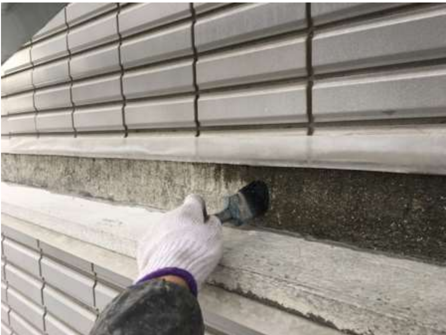
塔屋周囲タイル取合 プライマー塗布