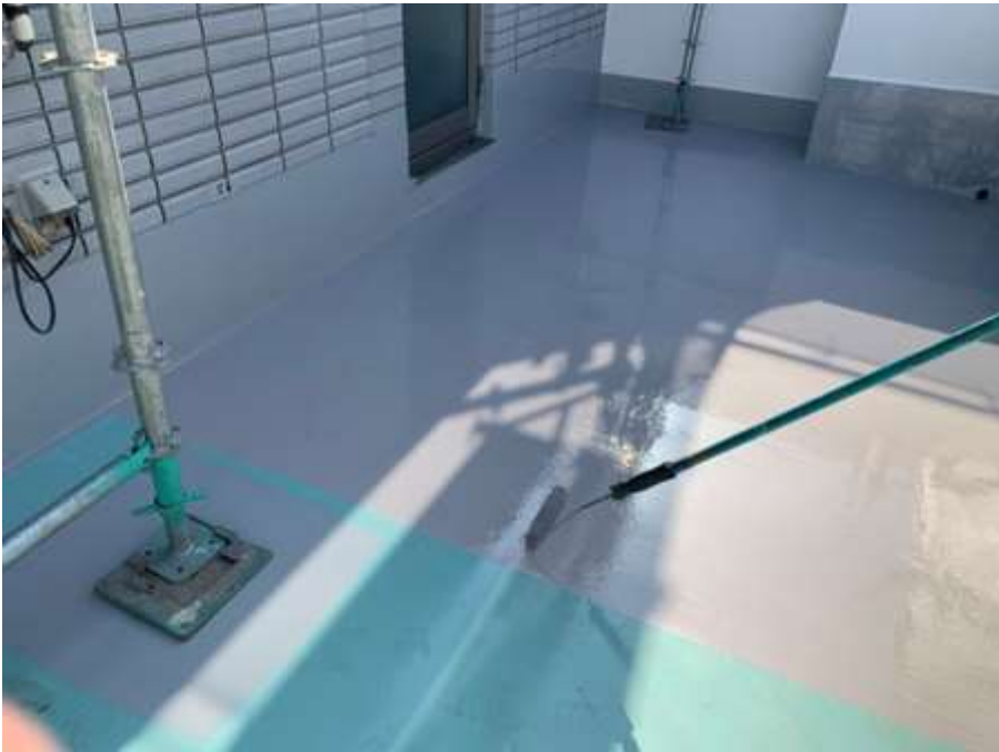
6階ルーフバルコニー 平場 トップコート塗布