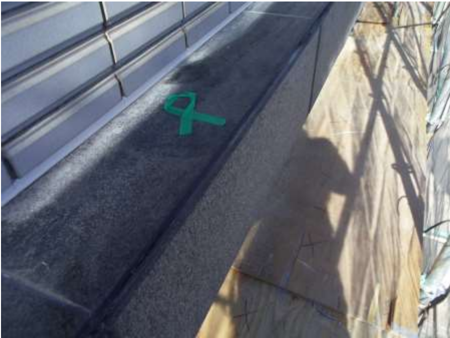
石目地撤去打替え 施工前