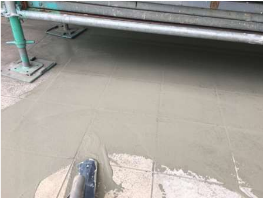
2階ルーフバルコニー 床タイル部分 樹脂モルタル成形