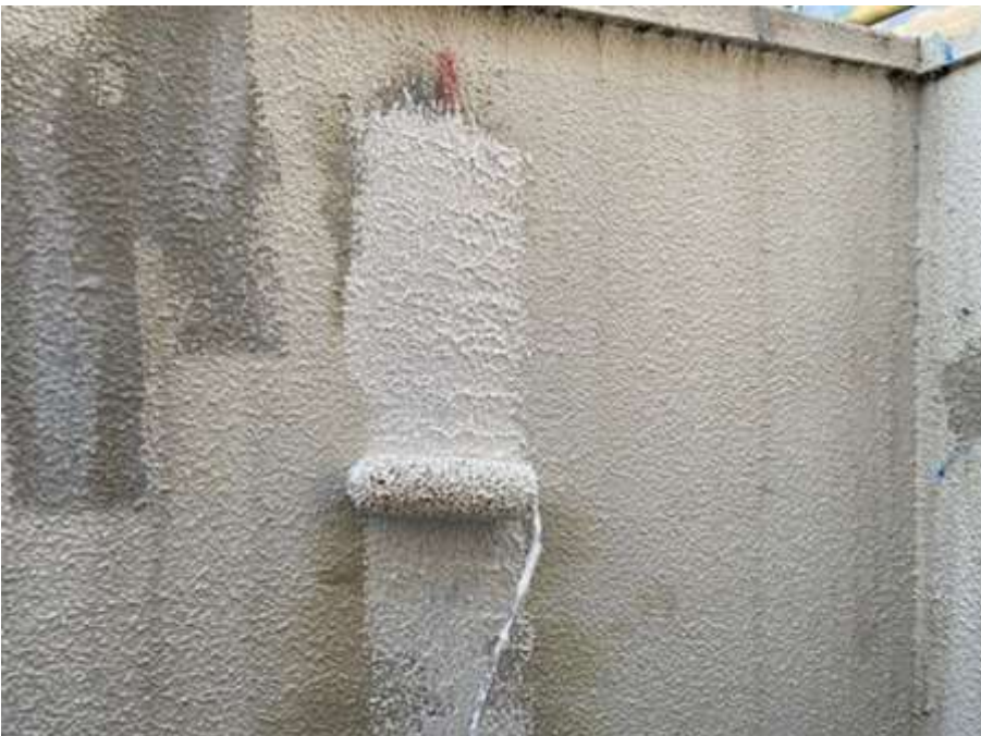
6階ルーフバルコニー パターン付け