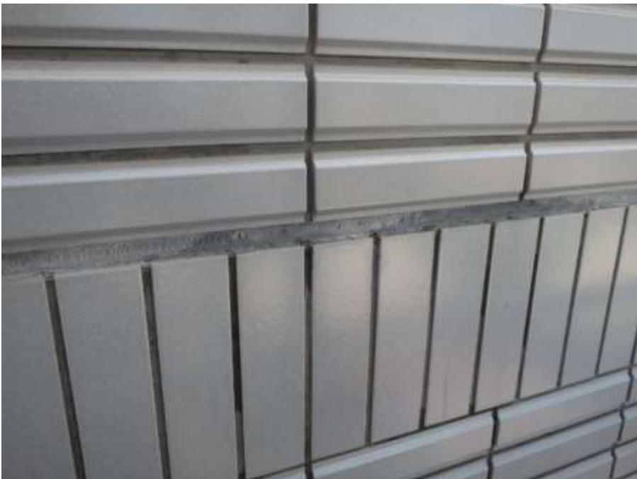
打継目地 シーリング打替え 施工前