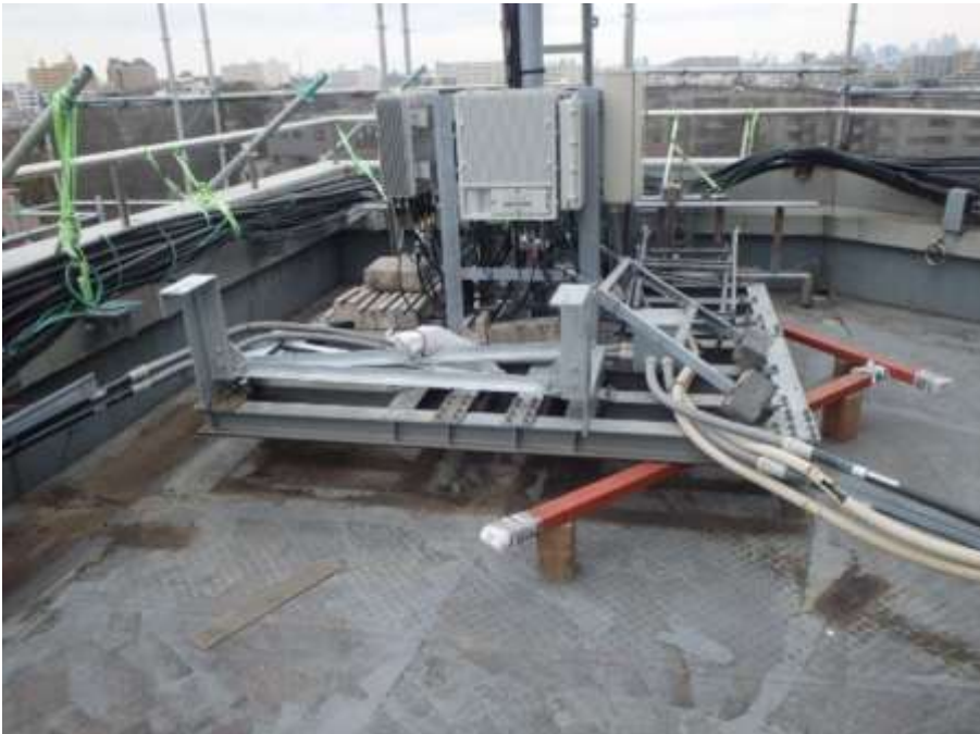
屋上 アンテナ基地局 揚げ養生①