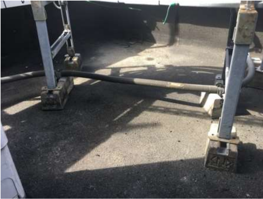
4階ルーフバルコニー 施工前