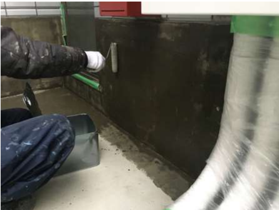
3階ルーフバルコニー 立上り プライマー塗布