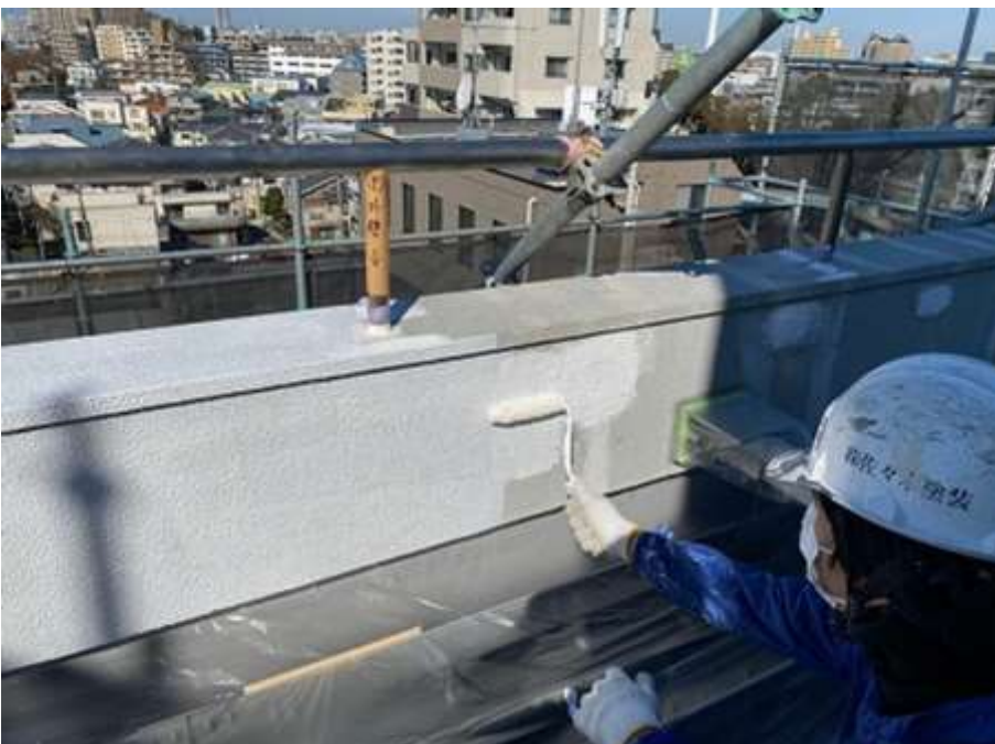
屋上パラペット 及び腰壁 下塗り