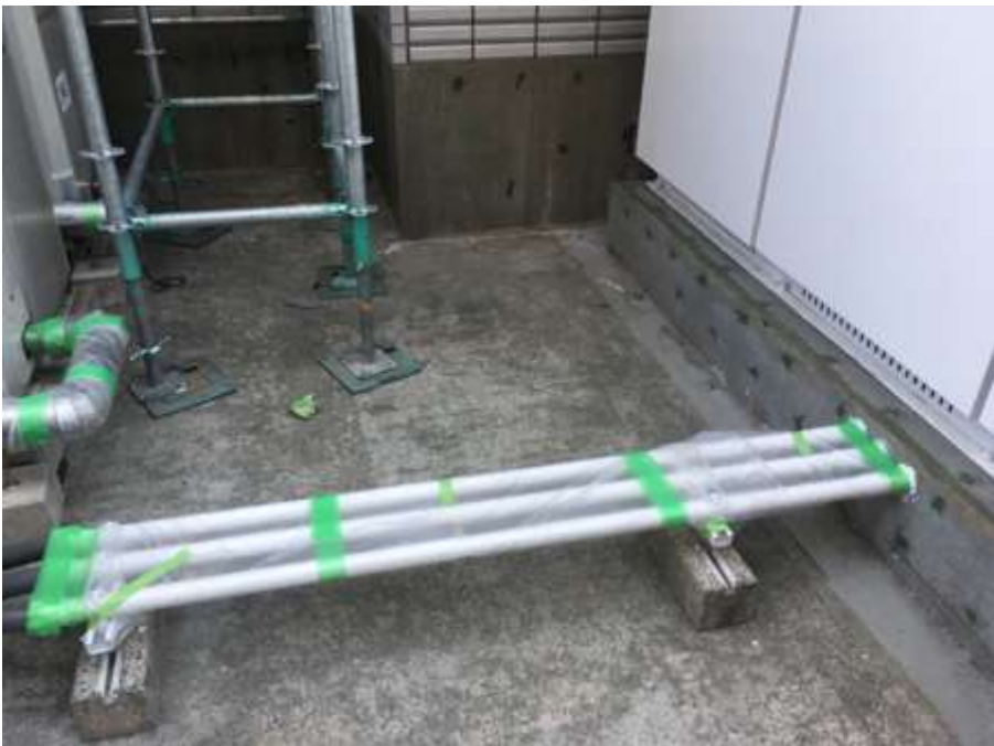
3階ルーフバルコニー 施工前②