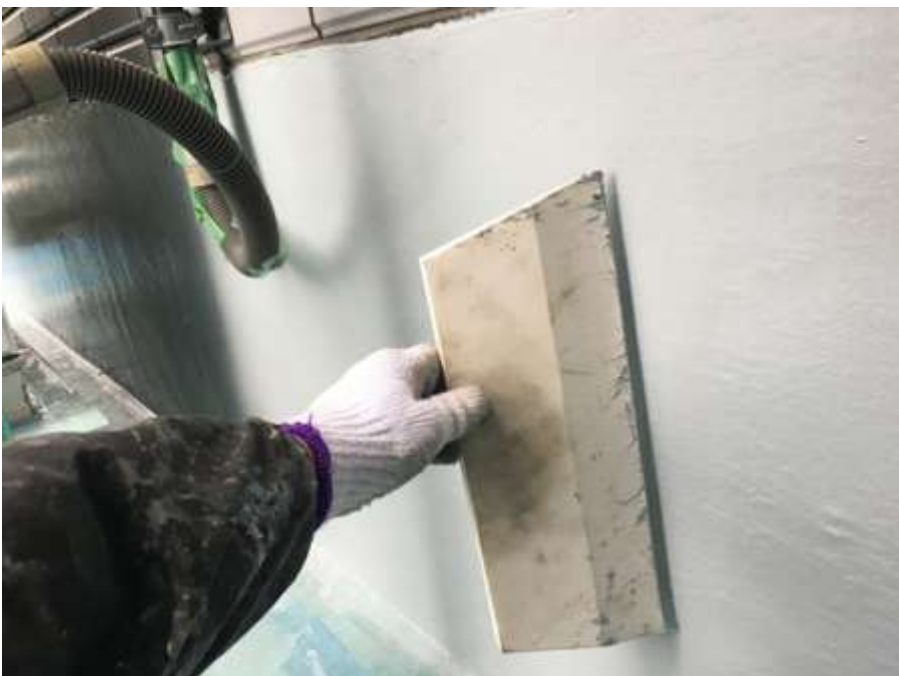
3階ルーフバルコニー 立上り 高強度型ウレタン 一層目