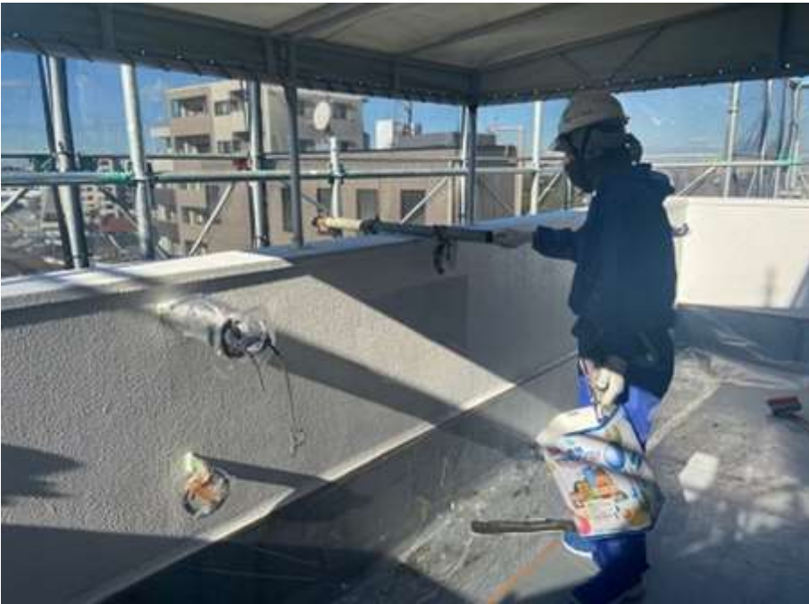
6階ルーフバルコニー 中塗り