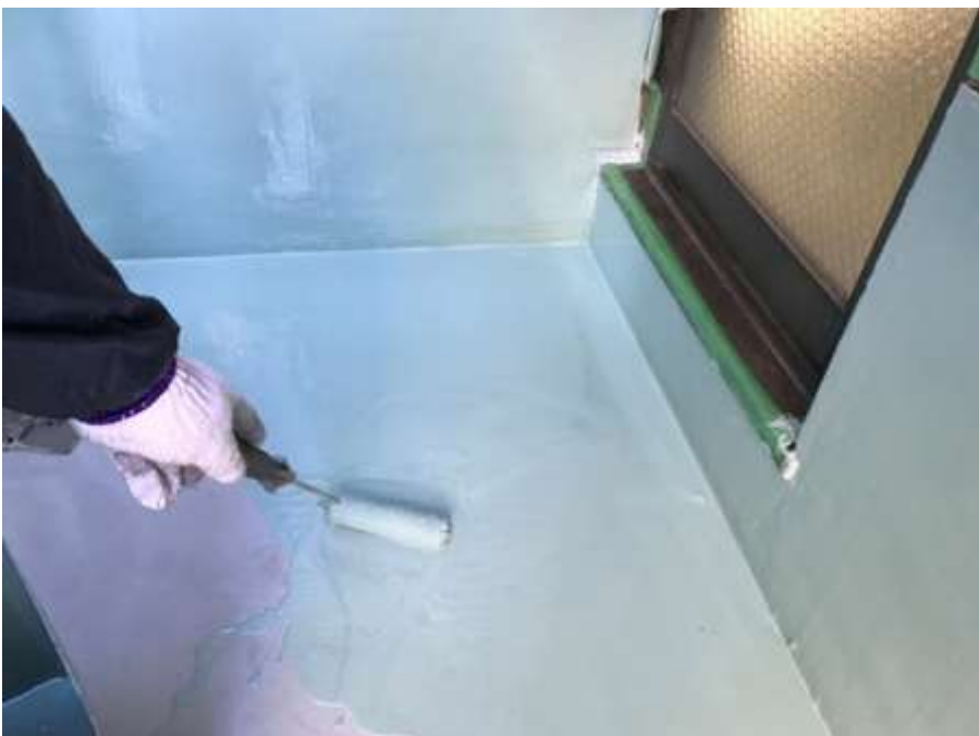
3階ルーフバルコニー 平場 高強度型ウレタン 二層目