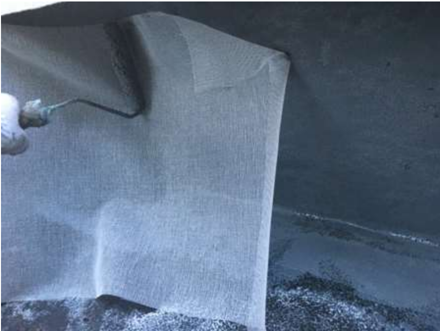
4階ルーフバルコニー 立上り 補強クロス貼付け