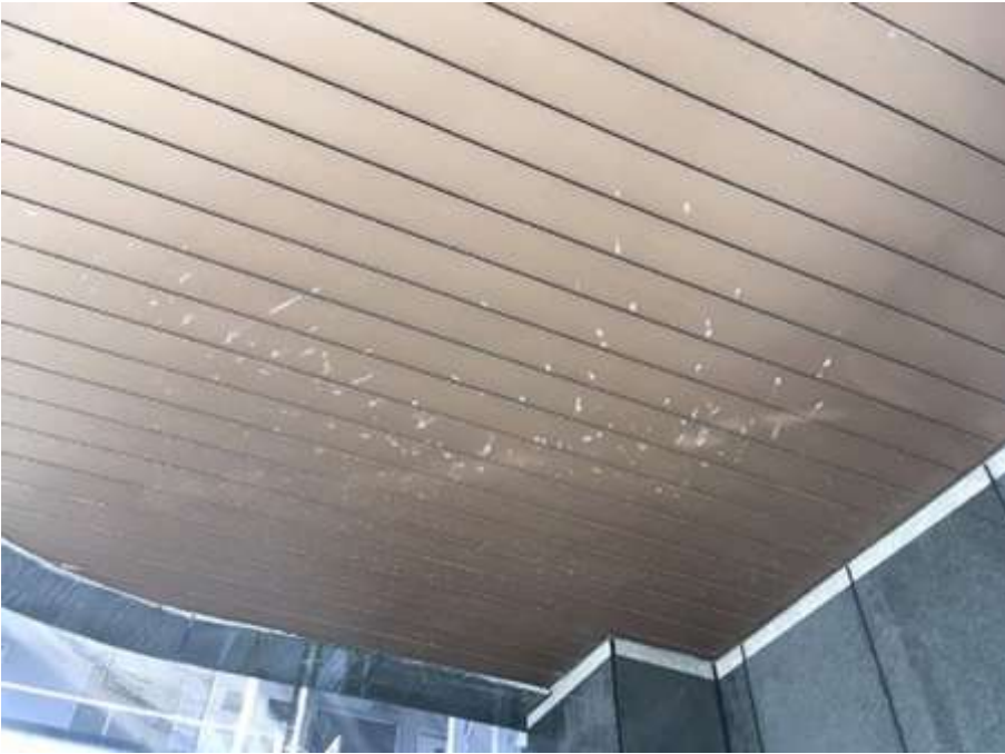
1階南車庫天井 アルミスパンドレイル 施工前