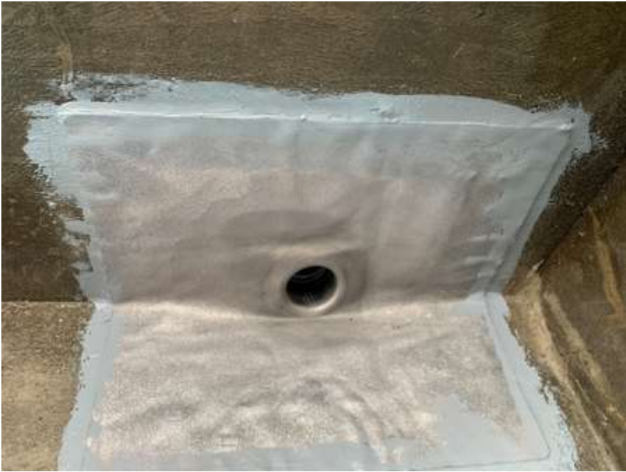
3階ルーフバルコニー 改修ドレン取付け