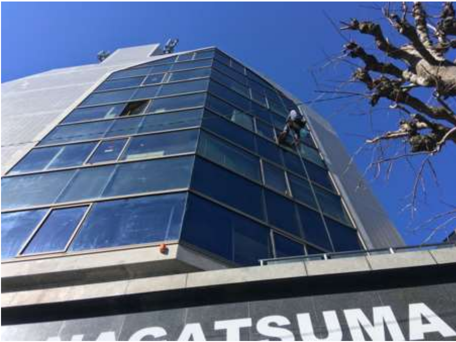
カーテンウォール 及びガラス清掃②