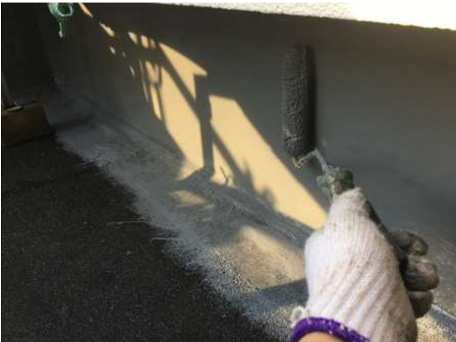
4階ルーフバルコニー 立上り 高強度型ウレタン 一層目