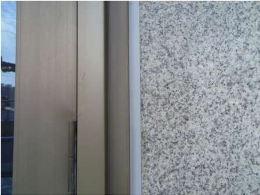
カーテンウォール周囲 シーリング打替え 完了