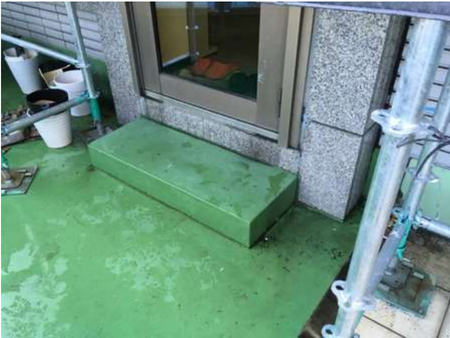
2階ルーフバルコニー カーテンウォール部 施工前