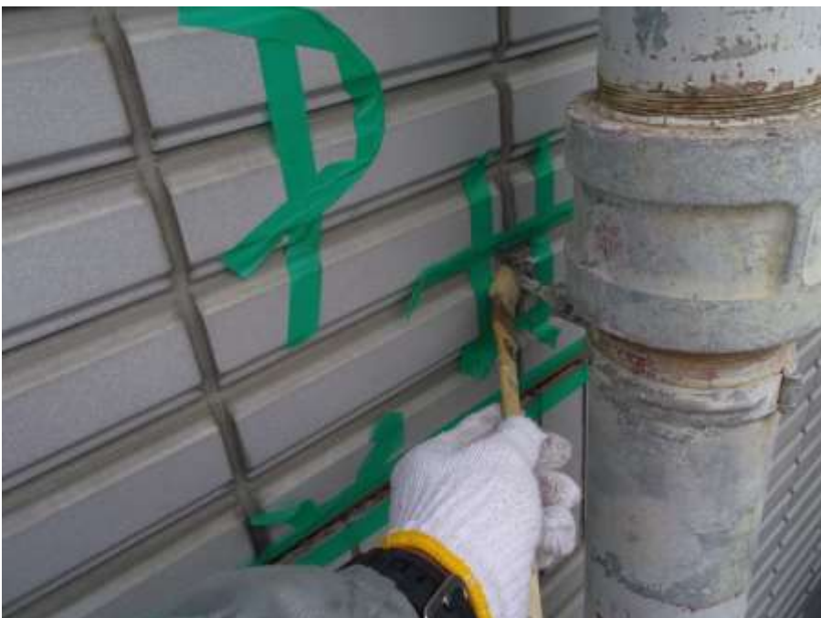
_____ 樋吊金物根元 プライマー塗布 _____ _____ _____ _____ _____ _____