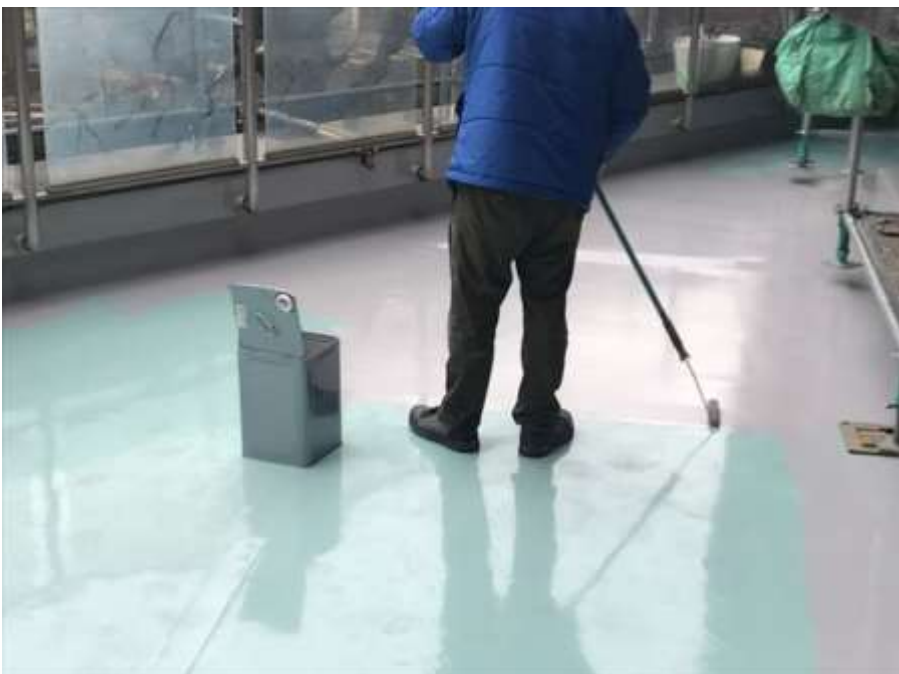
2階ルーフバルコニー 平場 トップコート塗布