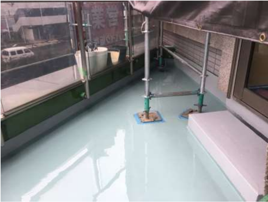
2階ルーフバルコニー 平場 高強度型ウレタン 二層目塗布後